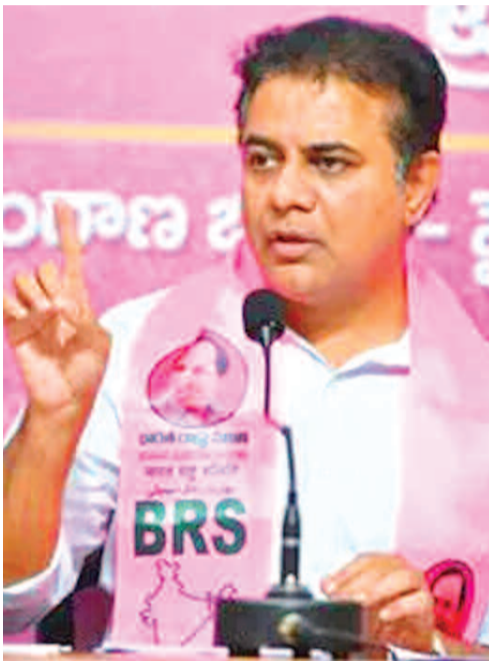
అంతా గమనిస్తున్నారని.. ఇలాంటి ఘోరాలను చూస్తూ

హైదరాబాద్, (ప్రభాత సూర్యుడు): రైతులపై బ్యాంకు సిబ్బంది వ్యవహారంపై తీరు సరైనదికాదని, కొన్ని సంఘటనలు చూస్తే మనసు చలిస్తుందని బీఆర్ఎస్ వర్కింగ్ ప్రెసిడెంట్, మాజీ మంత్రి కేటీఆర్ ఎక్స్ వేదికగా మండిపడ్డారు. స్వరాష్ట్రంలో కాంగ్రెస్ అధికారంలోకి వచ్చినందుకు.. కష్టాల్లో ఉన్న పాడి రైతు లోన్ కట్టలేదని.. ఎక్కడా ఆ ఇంటికి ఉన్న గేటును బ్యాంక్ సిబ్బంది ఎత్తుకెళ్తారని.. మరి రైతులందరికీ రూ. 2 లక్షల రుణమాఫీ చేస్తానని.. మాటతప్పిన ముఖ్యమంత్రిపై చర్య తీసుకునే డైరెక్టుమండా అని ప్రశ్నించారు. రుణం తీర్చలేదని రైతుపై చూపిన ప్రతాపాన్ని.. రుణమాఫీ చేయని సీఎం రేవంత్ రెడ్డిపై చూపించగలరా.. అని అన్నారు. పేద రైతు కు ఒక న్యాయం.. పదవీలో ఉన్న వారికి మరో న్యాయమా.. అని ప్రశ్నించారు. కాంగ్రెస్ నేతలు గుర్తు పెట్టుకోవాలని, రైతులు