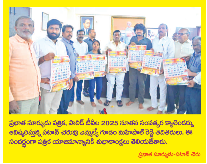
ప్రభాత సూర్యుడు పత్రిక, సావిత్రి డివీల్ 2025 నూతన సంవత్సర క్యాలెండర్లు ఆవిష్కరిస్తున్న పటాన్ చెరువు ఎమ్మెల్యే గూడెం మహిపాల్ రెడ్డి తిరుగుతుంది. ఈ సందర్భంగా పత్రిక యాజమాన్యానికి శుభాకాంక్షలు తెలియజేశారు.

సంపుటి: 2 సంచిక: 240 పేజీలు: 4 వెల: రూ.5/-