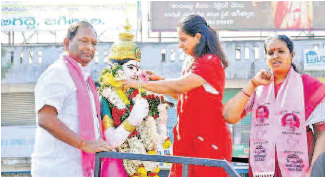
ఓక్కో మహిళకు సీఎం రూ.30వేల బాకీ

ఊరూరా ఉద్యమ తల్లినే ప్రతిష్ఠిస్తం విగ్రహంలో బతుకమ్మను కాపాడుకుంటం జీవోలు, కేసులతో భయ పెట్టలేరు తెలంగాణ అస్తిత్వంపై కాంగ్రెస్ సర్కార్ దాడిని గ్రామగ్రామాన ఎండగడుతం తెలంగాణ జాగృతి అధ్యక్షురాలు కవిత ధర్మాలో 22 అడుగుల తెలంగాణ తల్లి విగ్రహ ప్రతిష్ఠాపనకు భూమి పూజ