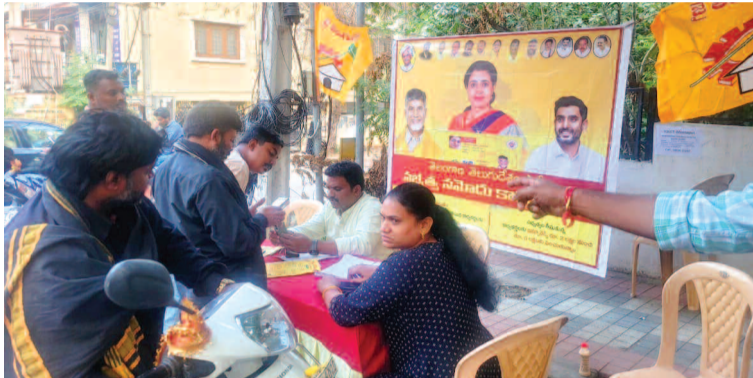
మాసాపేట్ లో జరిగిన అంజయ్య నగర్ లో తెలుగుదేశం పార్టీ సభ్యత్వాన్ని నమోదు చేసుకుంటున్న ఎన్టీఆర్ అభిమానులు, తెలుగుదేశం పార్టీ శ్రేణులు

నారా చంద్రబాబు నాయుడు తెలంగాణ లో సైతం తెలుగుదేశం పార్టీకి పూర్తి మద్దతు తెలుపుతామని దృఢ సంకల్పంతో వ్యూహం రూపొందించుకుని, కాంగ్రెస్, కేసీఆర్ బి ఆర్ ఎస్ పార్టీలను డెబ్బతీసి, తెలంగాణలో తెలుగుదేశం, బిజెపి, పవన్ కల్యాణ్ జనసేన పార్టీలతో జతకట్టి, త్వరలో తెలంగాణలో జరగనున్న స్థానిక సంస్థల ఎన్నికలకు, మునిసిపాలిటీ ఎన్నికలతో పాటు గ్రేటర్ హైదరాబాద్ ఎన్నికలలో ఉమ్మడిగా జతకట్టి గ్రేటర్ ఎన్నికల్లో పోటీ చేసి, అత్యధిక కార్పొరేషన్లను గెలుచుకొని హైదరాబాద్ మేయర్ పదవిని తెలుగుదేశం పార్టీ కైవసం చేసుకోవాలని, చంద్రబాబు నాయుడు రూపొందించుకున్న వ్యూహం రచనను తెలంగాణ తెలుగుదేశం పార్టీ శ్రేణులతో విశ్వసనీయంగా తెలిసింది.