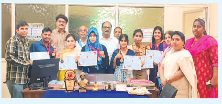
సత్య సాయి సేవ సమితి వారు నిర్వహించిన వ్యాసరచన పోటీల్లో గెలుపొందిన పటాన్ చెరువు ప్రభుత్వ డిగ్రీ కళాశాల విద్యార్థులు. పథకాలతో పాటు ప్రశంసా పత్రాలు