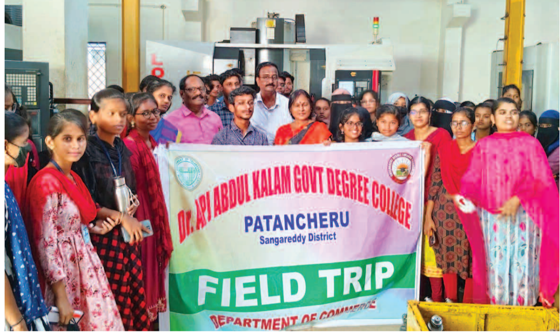
పరిశ్రమ కరికులంలో పాల్గొన్న పటాన్ చెరువు ప్రభుత్వ డిగ్రీ కళాశాల కామర్స్ డిపార్ట్మెంట్ విద్యార్థులు, విద్యార్థులు ప్రభుత్వ కళాశాల