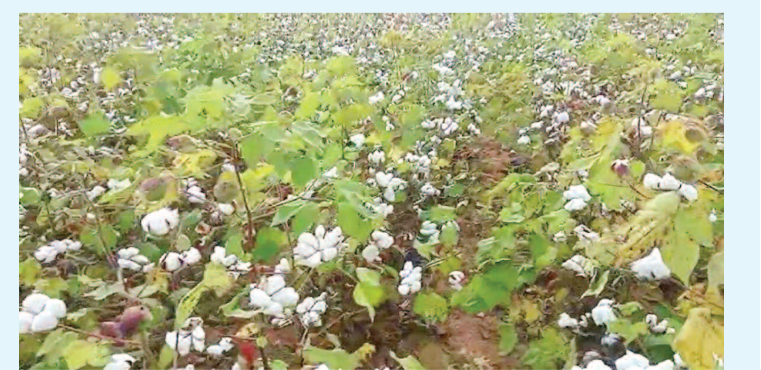
కనీసం 10 శాతం తేమ ఉంటుందని, అందువల్ల తేమ శాతంను 8 నుండి 10 కు పెంచాలని రైతులు వాపోతున్నారు. ఇకనైనా కేంద్ర, రాష్ట్ర ప్రభుత్వాలు అధికారులు పత్తి రైతులను దృష్టిలో ఉంచుకొని గిట్టుబాటు ధర అయ్యే విధంగా చూడాలని రైతులు కోరుతున్నారు

కల్లూరు - ప్రభాత సూర్యుడు ప్రత్తి సంవత్సరం కూలీలకు, పెన్సియన్స్ కు రేట్లు పెరుగుతున్నాయి. ఇలా ప్రతి సంవత్సరం రైతులకు అన్ని ఖర్చులు పెరుగుతున్నాయి పెరగనిది రైతు ఆదాయం ఒక్కటే. ఒకపక్క అంతుపట్టిన వాతావరణం, మరోపక్క పెట్టుబడి పెరగడం రైతుకు కంటి మీద కుసుకు లేకుండా చేస్తున్నాయి. పత్తి విత్తనాలు నాణ్యత నాణ్యత నుండి పంట చేతికి వచ్చి మంచి ధర వచ్చే వరకు పత్తి రైతుకు దిన దిన గండంలా మారుతుంది. టైమ్ కు వర్షాలు రాక పత్తి పంట ఏప్పుగా పెరగడం లేదు. దాంతో దిగుబడి తగ్గుతుంది. మరో పక్క అనుకోకుండా అతి వర్షాలు పడడం వల్ల కాత పూత రాలిపోవడంతో కూడా దిగుబడి తగ్గి రైతుకు నష్టం చేస్తుంది. కొంత మంది రైతులకు యాజమాన్య పద్ధతులు తెలియక పోవడం మరి ముఖ్యంగా ఏ సమయంలో ఏ చెయ్యాలి సలహాలు సూచనలు ఇచ్చే వారు కరువయ్యారు. ఒకవేళ రైతు సమావేశాలు పెట్టినా అవి తూ తూ మంత్రంగానే సాగుతున్నాయి అనేది కొంత మంది రైతుల మాటలు. ఇక అన్నీ బాగుండి తీరా చేతికి పంట వస్తే మద్దతు ధర లేక పత్తి రైతు విలవిలలాడుతున్నారు. ముఖ్యంగా తేమ శాతం పత్తి రైతుల నెత్తిన కుంపటిగా మారింది. మొదట చేతికి వచ్చే పంటలో