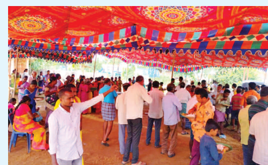
పిల్లలు మహిళలు భక్తులు అధిక సంఖ్య లో పాల్గొన్నారు. దశావతారాలలో అఖరుగా శనివారంనాడు విజయ దశమి సందర్భంగా జగన్మాత కనకదుర్గమ్మ శ్రీరాజాజేశ్వరి దేవిగా భక్తులకు దర్శనమిస్తుంది. ఉత్సవాల ముగింపు సందర్భంగా 12వ తేదీ ఉదయం అమ్మవారికి నివేదన అనంతరం పూజావాతీ

కల్లూరు - ప్రభాత సూర్యుడు మండల పరిధిలో ముగ్గు వెంకటాపురం రామాలయం లో ఏర్పాటు చేసిన దసరా శరన్నవరాత్రుల్లో భాగంగా తొమ్మిదవ రోజైన శుక్రవారం ఆశ్చర్యముజ శుద్ధ నవమి నాడు జగన్మాత కనకదుర్గమ్మ శ్రీ మహిషాసురమర్ధిని దేవిగా దర్శనమిస్తుంది. అన్న భుజాలతో దుష్టుడైన మహిషాసురుడిని అమ్మవారు సంహరించింది ఈ రూపంలోనే. అందుకే ఇది నవదుర్గలో అత్యుగ్రహం. ఈ రోజున జగన్మాత కనకదుర్గమ్మ లేతరంగు దుస్తుల్లో సింహ వాహనాన్ని అధిష్టించి ఆయుధాలను ధరించిన మహాశక్తిగా భక్తులను సాక్షాత్కరిస్తుంది. ఈ తల్లికి గారెలు, బెల్లంతో కలిపిన అన్నాన్ని వైవేద్యంగా నివేదిస్తారు. ఇదిలా ఉండగా దసరా శరన్నవరాత్రులు తుది ఘట్టానికి చేరుకున్న సందర్భంగా ముగ్గు వెంకటాపురం భక్తులు మహా అన్నదాన కార్యక్రమం నిర్వహించడం జరిగింది ఈ అన్నదాన కార్యక్రమం లో పెద్దలు