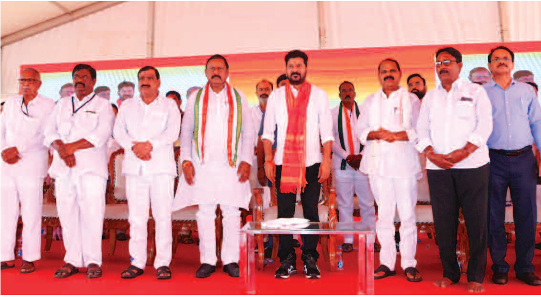
కేసీఆర్ రూ.7 లక్షల కొట్టు అప్పు చేశారని, రెసిడెన్షియల్ స్కూల్లో మౌలిక వసతులు కల్పించాలనే కనీస ఆలోచన చేయలేదని కేసీఆర్ పాలనపై సీఎం రేవంత్ మండిపడ్డారు.

చేరగానే ఆర్ఎస్ ప్రవీణ్ ఆలోచన విధానం మారినది రేవంత్ అన్నారు. ఎస్సీ, ఎస్టీలు ఇంకా బానిసలుగానే బతకాలని భావిస్తున్నారా అని సీఎం నిలదీశారు. పదేండ్లలో బర్రెలు, గొర్రెలు ఇచ్చాడే తప్ప మంచి చదువు ఇచ్చారా అని సీఎం ప్రశ్నించారు. విద్యా వ్యవస్థలో మార్పులపై ఎంతో ఆలోచించామని, నిపుణులు, మేధావులతో ఎంతో చర్చించామని సీఎం చెప్పారు. మేధావులతో చర్చించాకే ఈ న్యూజ్ నిర్మాణానికి నిర్ణయం తీసుకున్నామని తెలిపారు. ప్రతి విద్యార్థికి నాణ్యమైన విద్యను అందిస్తామని, విద్యా ప్రమాణాలు పెంచడమే తమ ప్రభుత్వ లక్ష్యమని సీఎం రేవంత్ స్పష్టం చేశారు. గత ప్రభుత్వం 5 వేల ప్రభుత్వ న్యూజ్లను మూసేసినదని, పేదలను విద్యకు దూరం చేయాలని బీఆర్ఎస్ కుట్ర వస్తుందని సీఎం ఆరోపించారు. ఎలాంటి వివారం లేకుండా టీడీపీ బదిలీలు చేపట్టమని, అర్హతైన టీడీపీలకు ప్రమాణం, బదిలీలు చేశామని డీఎస్సీ నియామకాలను గుర్తు చేశారు. విద్యార్థుల భవిష్యత్ కోసమే యంగ్ ఇండియా రెసిడెన్షియల్ స్కూల్స్ను తీసుకొచ్చినట్లు సీఎం రేవంత్ రెడ్డి వివరించారు. బుర్రా వెంకటేశం లాంటి వ్యక్తులు రెసిడెన్షియల్ స్కూల్లోనే చదివారని గుర్తుచేశారు. రూ.22 లక్షల కొట్టు ఖర్చు చేసిన కేసీఆర్ పాఠశాలలను బాగు చేయలేదని సీఎం రేవంత్ రెడ్డి వివరించారు. పదేండ్లలో