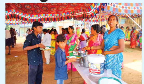
కార్యక్రమం జరుగుతుంది. అనంతరం సాయం సందర్భా సమయంలో ముగ్గు వెంకటాపురం వీధుల్లో అమ్మవారిని ఉడికిస్తారు. ఈ కార్యక్రమం లో ముగ్గు వెంకటా పురం అమ్మవారి కమిటీ కుర్రాళ్ళు మరియు భవని భక్తులు, వంచాయతీ పెద్దలు తదితరులు అన్నదాన కార్యక్రమం లో పాల్గొన్నారు.