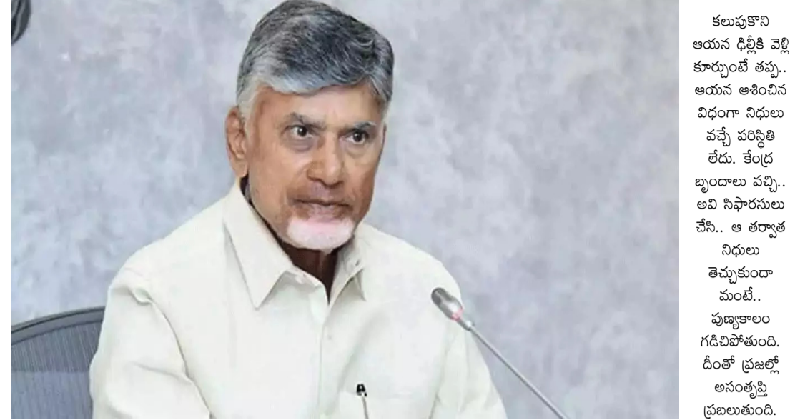
నిధులు సాధించాలని పరిశీలకులు చెబుతున్నారు. నిజానికి ఇప్పుడు చంద్రబాబు చేతిలో 15 మంది ఎంపీలు ఉన్నారు. మిత్రపక్షాలు జనసేనకు ఇద్దరు, బీజేపీకి నలుగురు ఎంపీలు ఉన్నారు. వీరందరినీ

దీంతో చంద్రబాబు ఆయా ప్రాంతాల్లో ఎక్కడకు వెళ్లినా... సాయం కోసం అర్జిస్తున్న కేతులే కనిపిస్తున్నాయి. తమను ఆదుకోవాలన్న ఆవేదనే వినిపిస్తోంది. అధికారం చేపట్టిన మూడు మాసాల్లోనే ఇంత విపత్తును ఎదుర్కొన్నారని రావడం నిజంగానే.. ఎంత అనుభవం ఉన్న నాయకుడికైనా ఇబ్బందే. మైగా గత ప్రభుత్వం అజానాను ఖాళీ చేసిందని.. చంద్రబాబు పదే పదే చెబుతున్నారు. అయినా... కష్టం లో ఉన్నవారికి ఇవన్నీ కనిపించవు. వారికి కావాల్సింది చేయాలిందే. ఈ నేపథ్యంలో చంద్రబాబు తన పూర్వం మార్పుకుంటే తప్ప... రాష్ట్రంలో నిధులు వరద పాలేలా కనిపించడం లేదని అంటున్నారు పరిశీలకులు. ప్రస్తుతం కేంద్రంలో పాత్ర పెట్టుకున్న చంద్రబాబు.. అ నేక సంధర్భాల్లో ఢిల్లీ వెళ్లారు. పోలవరానికి నిధులు, అమరావతి నిర్మాణం వంటివాటిపై స్పందించారు. అయితే.. ఇప్పుడు ఆ రెండింటి మించిన కష్టంలో ప్రజలు వున్నారు. వీరిని ఇప్పుడు సంకల్పి కర స్థాయిలో ఆదుకోకపోతే.. చంద్రబాబుకు ద్వారాపేటి మిగిలిపోతుంది. వచ్చే నాలుగున్నరేళ్లు.. ఆయన ఏం చేశారు.. ఏం చేస్తారు? అనేది ఎలా ఉన్నా.. ఇప్పుడు ప్రజలకు వచ్చిన కష్టం తీర్చడం ముఖ్యం. ఈ నేపథ్యంలో కేవలం నివేదికలు ఇచ్చి మౌనంగా ఉంటే కుదరదని, నేరుగా ఢిల్లీకి వెళ్లి అవసరమైతే.. రెండు రోజులు తిప్పేసే అయినా..