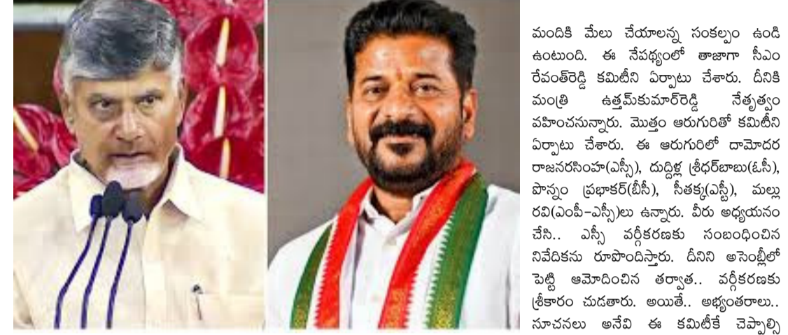
రాష్ట్రాన్ని యూనిట్ గా తీసుకుని వర్గీకరణ చేయాలని భావిస్తున్నారు. ఉంటుంది. అదేసమయంలో ఈ కమిటీ ఎస్సీ సంఘాల నాయకులతో తెలంగాణలో మాదిగ సమాజం ఎక్కువగా ఉన్నందున.. ఎక్కువ సమావేశాలు నిర్వహించి.. వారి అభిప్రాయాలను తెలుసుకుంటుంది.

అయితే.. ఎవరిని హెచ్చించకుండా జాగ్రత్తగా నిర్ణయాలు తీసుకోవాలని మంత్రులు తేల్చి చెప్పింది. అన్ని వర్గాల ను ప్రాధాన్యం అంతంగా తీసుకుని.. వర్గీకరణ చేయాల్సి ఉందని పేర్కొంది. ఇదేసమయంలో రాజకీయ జోక్యానికి తావు ఉండరాదని కూడా స్పష్టం చేసింది. ఇదేసమయంలో తేడావస్తే.. తాము నేతృత్వం చేసు కుంటామని కూడా సుప్రీంకోర్టు తేల్చి చెప్పింది. ఈ నేపథ్యంలో ఏపీ ప్రభుత్వం దీనిపై అధ్యయనం చేస్తోంది. ఎలా వర్గీకరించాలన్న విషయం పై ఏపీ సీఎం చంద్రబాబు ఒక నిర్ణయానికి వచ్చారు. జిల్లాలను యూనిట్ గా తీసుకుని ఏపీలో వర్గీకరణ చేయాలని భావిస్తున్నారు. దీనికి కారణం.. కొన్ని కొన్ని జిల్లాల్లో మాత్రం సామాజిక వర్గం ఎక్కువగా ఉంది. మరొకటి వోట్ల హాదిగలు ఎక్కువగా ఉన్నాయి. దీంతో వారితో ఎవరికీ ఇబ్బందులు లేకుండా.. వ్యవహారాలను ఉద్దేశ్యంతో ఈ నిర్ణయం తీసుకున్నారు. అయితే.. ఇప్పుడు తెలంగాణ విషయానికి వస్తే.. సీఎం రేవంత్ రెడ్డి మరో నిర్ణయం తీసుకున్నారు.