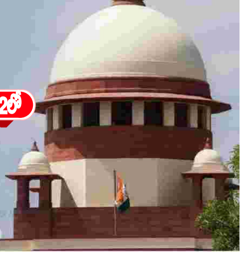
రాజకీయ కక్ష సాధింపులకు న్యాయస్థానాన్ని వేదికగా మార్చుకోవద్దంటూ ఆర్టీను సుప్రీంకోర్టు మందలించింది. ఆధార రహిత అంశాలను తీసుకొచ్చి కోర్టుతో ఆలూడుకోవద్దని హెచ్చరించింది.

ప్రభుత్వంపై ప్రతినెలా రూ.260 కోట్ల వరకు అదనపు భారం!