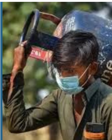
మరోసారి తగ్గిన కమర్షియల్ గ్యాస్ సిలిండర్ ధర

మ్యూడిల్ని - ప్రభాత సూర్యుడు ధరల మోతతో ఇబ్బంది పడుతున్న గ్యాస్ వినియోగదారులకు దేశీయ చమురు సంస్థలు ఉపశమనం కలిగించాయి. మరోసారి తగ్గిన కమర్షియల్ గ్యాస్ సిలిండర్ ధర.. తగ్గించి వాణిజ్య అవసరాలకు వినియోగించే ఎల్.జి.సి సిలిండర్ ధరను తగ్గించాయి. 19 తగ్గించి సిలిండర్ పై రూ.30 మేర తగ్గిస్తున్నట్లు ప్రకటించాయి. తగ్గిన ధరలు ముందే, కొరతకా, చెన్నై సహా దేశవ్యాప్తంగా నేటి నుంచి అంటే జులై 1వ తేదీ నుంచే అమల్లోకి వస్తాయని వెల్లడించాయి. చమురు సంస్థల నిర్ణయంతో దేశ రాజధాని ఢిల్లీలో రూ. 1.676గా ఉన్న వాణిజ్య గ్యాస్ సిలిండర్ ధర రూ. 1.646కి తగ్గింది. అదేవిధంగా ముంబైలో రూ.1.629 నుంచి రూ. 1.598కి తగ్గింది. ఇక చెన్నైలో రూ. 1.840గా ఉన్న ధర ఇప్పుడు రూ. 1.809కి పడిపోయింది. అదే విధంగా కొలకాతాలో రూ. 1.787 ఉన్న కమర్షియల్ సిలిండర్ ధర రూ. 1.756కి తగ్గింది. స్థానిక పమ్మల ఆధారంగా రాష్ట్రాలను బట్టి ధరలలో మార్పులు ఉంటాయి. కాగా, తెలంగాణ గత రెండు నెలల నుంచి కమర్షియల్ సిలిండర్ ధరలు తగ్గుతూ వస్తున్న విషయం తెలిసిందే. జూన్ 1వ ఎటెన్షన్ రేటు దాదాపు రూ.69 తగ్గగా, మే 1వ సిలిండర్ పై రూ.19 తగ్గింది. ఇక 14.2 కిలోల గృహ వినియోగ వలస గ్యాస్ ధరలు యధావధిగా కొనసాగుతున్నాయి.