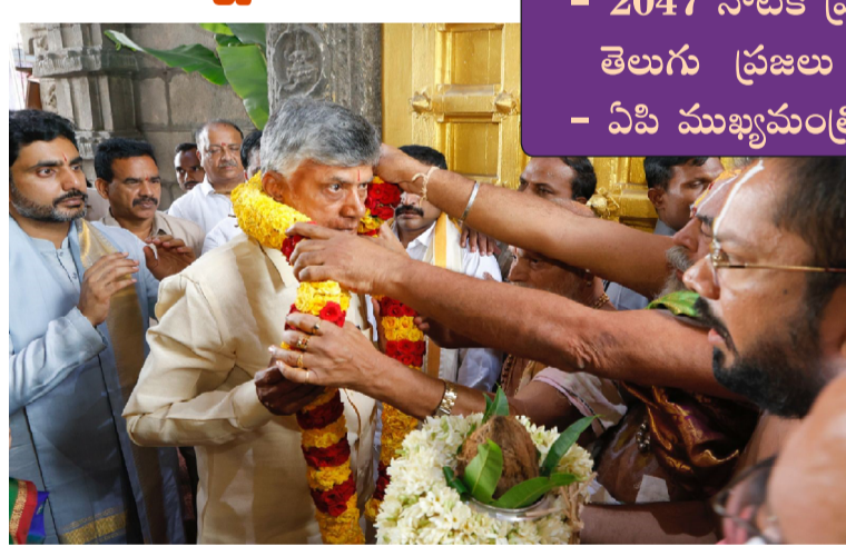
తిరుమల - ప్రభాత సూర్యుడు

తిరుమలలోని శ్రీ గాయత్రీ నిలయం విశ్రాంతి గృహంలో ఏర్పాటు చేసిన మీడియా సమావేశంలో సీఎం మూట్లడుతూ, 2047 నాటికి భారతదేశం ప్రపంచంలోనే అగ్ర రాజ్యంగా ఆవిర్భవిస్తుందని, ఇందులో తెలుగువారిని నెంబర్ వన్ స్థానంలో నిలిపేందుకు తనకు శక్తిని ప్రసాదించమని స్వామి వారిని ప్రార్థించినట్లు తెలిపారు. తాను ఈ ప్రాంత స్థానికుడు కావడంతో ప్రతి రోజు శ్రీవేంకటేశ్వర స్వామి స్మరణతోనే తనకు రోజు ప్రారంభమవుతుందన్నారు. తన చిన్ననాటి జ్ఞాపకాలను గుర్తు చేసుకుంటూ, తన పాఠశాల, కళాశాల రోజుల్లో శ్రీనివాసమంగాపురం, తిరుపతికి నడిచి వెళ్లే సమయంలో తిరుమల శ్రీవారిని స్మరించుకున్నట్లు చెప్పారు. "శ్రీవేంకటేశ్వర