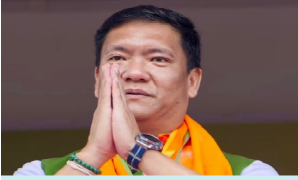
అరుణాచల్ ప్రదేశ్ ముఖ్యమంత్రిగా పెమా ఖండూ గురువారం ప్రమాణస్వీకారం చేశారు. ఆయన ముఖ్యమంత్రిగా కొనసాగడం వరుసగా ఇది మూడోసారి. ఆయనతో పాటు