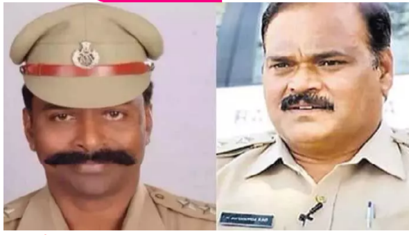
ఛార్జ్ షీట్ దాఖలు: