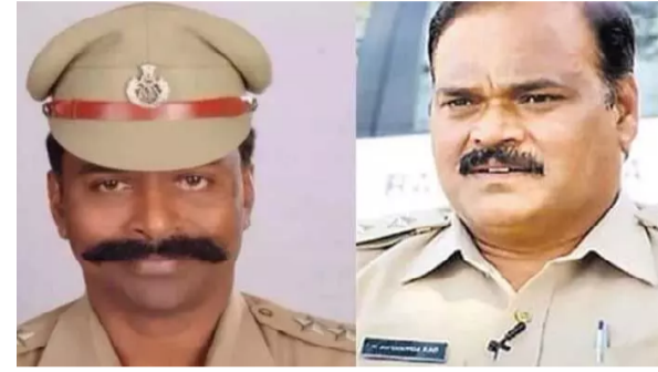
మొదటి పేజీ తరువాత

కూడా ఉన్నారు వేలాది పేజీల్లో అభియోగాలను బలపరిచే పత్రాలు పొందుపరిచారు సాంకేతిక పరిజ్ఞానంతో కూడిన అంశాలు ఉండడంతో మరిన్ని ఆధారాలు సేకరించాల్సి ఉందని ఫోలీసులు పేర్కొన్నారు.