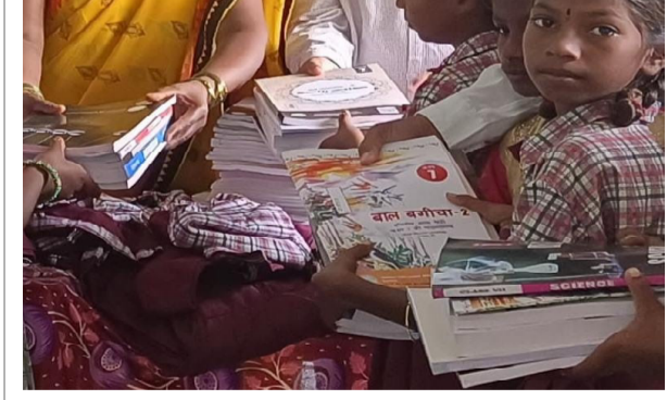
హైదరాబాద్ - ప్రభాత సూర్యుడు

రాష్ట్ర వ్యాప్తంగా ప్రభుత్వ పాఠశాలల్లో పాఠ్య పుస్తకాల పంపిణీ కొత్త గందరగోళానికి దారితీసింది. రాష్ట్ర వ్యాప్తంగా బుధవారం పాఠశాలలు పున: ప్రారంభం కావడంతో ఆయా జిల్లాల్లో అధికారులు, ఉపాధ్యాయులు 1వ తరగతి నుంచి 10వ తరగతి వరకు పాఠ్య పుస్తకాలు వాటితో పాటు వర్క్ బుక్లను కూడా పంపిణీ చేశారు.