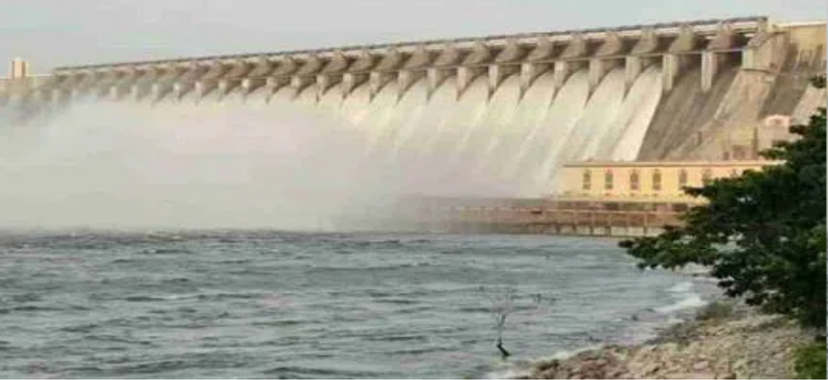
కరీంనగర్ - ప్రభాత సూర్యుడు