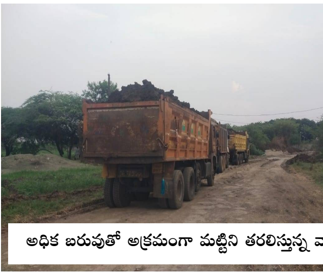
అధిక బరువుతో అక్రమంగా మట్టిని తరలిస్తున్న వాహనాలు

నడుస్తున్నా.. అనుమతులు ఇచ్చిన ఇరిగేషన్ శాఖ అధికారుల పర్యవేక్షణ లోపం కళ్ళకు కొట్టొచ్చినట్టు కనిపిస్తుంది. ఇరిగేషన్ శాఖ అనుమతులు ఉన్నా మైనింగ్ శాఖ అనుమతులు ఉండనవసరం లేదా అని స్థానిక ప్రజలు ప్రశ్నిస్తున్నారు. స్థానిక రైతుల అవసరార్థం పంట పొలాలకు ఇవ్వాలని మట్టిని ఇవ్వకుండా, వేలల్లో అమ్ముకుంటున్నారని, గత ప్రభుత్వంలో మిషన్ కాకతీయ పేరుతో ప్రతిష్టాత్మకంగా చేపట్టిన చెరువుల పూడికతీత పనులను దుర్వినియోగం చేస్తున్నారని పలువురు రైతులు ఆగ్రహం వ్యక్తం చేస్తున్నారు. కండ్ల ముందే భారీ వాహనాల్లో ఓవర్ లోడ్ తో అక్రమంగా మట్టిని తరలిస్తున్నారాణా శాఖ ఆర్డిపి అధికారులకు మాత్రం కనబడడం లేదు. ఇప్పటికైనా కుంటూరు పెద్ద చెరువులో మట్టి తోవ్వకాలను ఇరిగేషన్, మైనింగ్ శాఖ అధికారులు పర్యవేక్షించాలని, ఓవర్ లోడ్ తో మట్టి తరలిస్తున్న వాహనాలపై ఆర్డిపి అధికారులు తనిఖీలు నిర్వహించాలని స్థానిక ప్రజలు విజ్ఞప్తి చేస్తున్నారు.