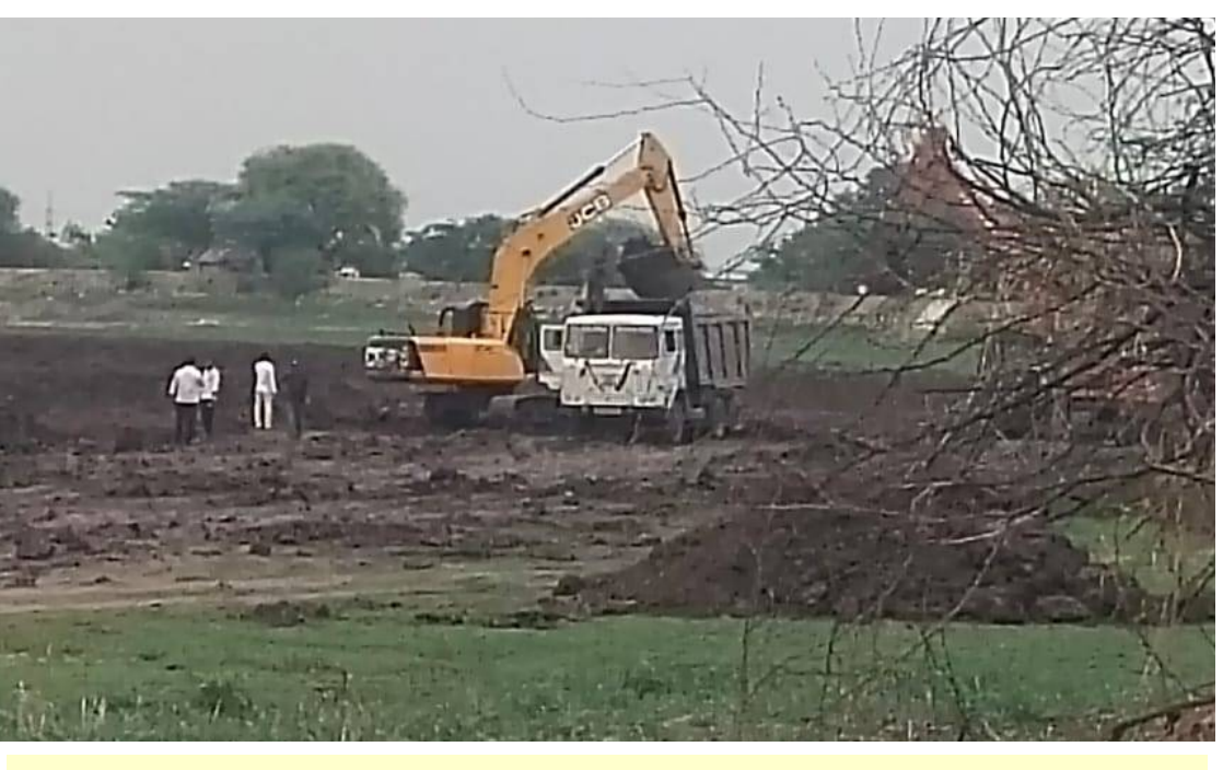
కుంటూరు పెద్ద చెరువులో నిబంధనలకు విరుద్ధంగా చేస్తున్న మట్టితోవ్వకాలు

రంగారెడ్డి - ప్రభాత సూర్యుడు : టన్నులు టన్నుల కొద్దీ భారీ వాహనాల్లో కుంటూరు పెద్ద చెరువు మట్టిని తరలిస్తున్న పట్టించుకునే నాధుడే కరువయ్యాడు. చెరువులో పూడికలు తీయిస్తున్నామనే సాకుతో సంఘం పెద్దలు పెద్ద ఎత్తు మట్టిని అమ్ముకుంటూ అక్రమాలకు పాల్పడుతున్నారు. కుంటూరు మత్స్యకారు సంఘంతో కుమ్మక్కై పెద్ద ఎత్తున మైనింగ్ మాఫియా నడుస్తున్నా కాంట్రాక్టర్ ఇచ్చే కాసులకు కక్కుర్తి పడి అటు మైనింగ్ శాఖ అధికారులు గాని, ఇటు ఇరిగేషన్ శాఖ అధికారులు గాని తమకేమీ పట్టనట్టు వ్యవహరిస్తున్నారు. ఇరిగేషన్ శాఖ అనుమతులు ఉన్నాయని ఇస్తానుసారంగా మట్టిని తవ్వే ఇటుక బట్టిలకు, ఇంటి నిర్మాణ దారులకు అమ్ముకుంటూ.. కోట్లలో డబ్బులు దండుకుంటున్నారు. తమను ఎవ్వరు అడిగేవాడు అన్న ధీమాతో ఫీట్ల కొద్ది మట్టి తవ్వకాలు జరిపి పెద్ద చెరువు మనుగడను దెబ్బతీస్తున్నారు. ఇంత పెద్ద ఎత్తున మైనింగ్ మాఫియా