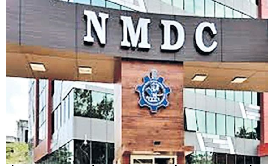
కోట్లను ప్రభుత్వం అంచనా వేయగా.. రూ.1,00,056 కోట్లను సమీకరించింది. 2018-19లో రూ.80,000 కోట్లను

బడ్జెట్లో ప్రభుత్వం అంచనా వేసింది. అయితే ఈ ఏడాది ఫిబ్రవరి 1న సవరించిన అంచనాల్లో.. పెట్టుబడుల ఉపసంహరణ ద్వారా సమీకరించే నిధుల వివరాలను వేరే విభాగం కింద ప్రభుత్వం చూపించింది. ఈ ప్రకారం.. కేబిల్ రిసీట్స్ కింద రూ.30,000 కోట్లు లభిస్తాయని పేర్కొంది. వీటిల్లో పెట్టుబడుల ఉపసంహరణ కింద సమీకరించే నిధులు రూ.20,000 కోట్లు కాగా.. ఆస్తుల సగడి కరణతో రూ.10,000 కోట్లు రావాచ్చని తెలిపింది. అంటే 2023-24లో పెట్టుబడుల ఉపసంహరణ ద్వారా సమీకరించిన రూ.16,507 కోట్లు.. ప్రభుత్వం అంచనా రూ.20,000 కోట్ల కంటే తక్కువే. 2018-19, 2017-18 మినహా.. దాదాపుగా ప్రతి ఆర్థిక సంవత్సరంలో పెట్టుబడుల ఉపసంహరణ లక్ష్యాన్ని ప్రభుత్వం అందుకోలేదు. 2017-18లో రూ.1 లక్ష