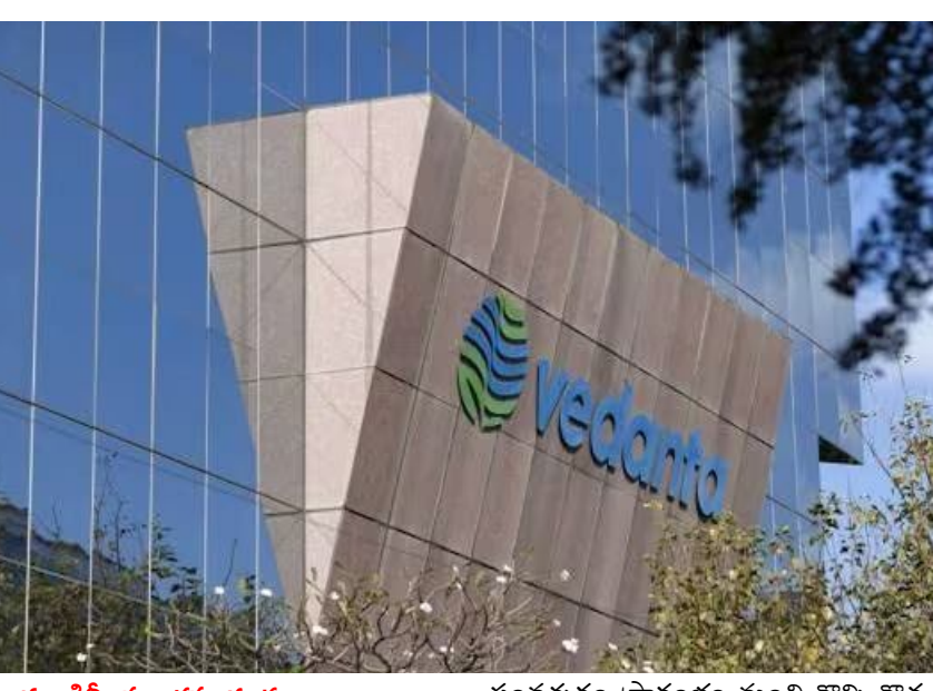
న్యూఢిల్లీ, ప్రభాతసూర్యుడు ఏప్రిల్ 1 నుంచి 2024-25 కొత్త ఆర్థిక సంవత్సరం మొదలైంది. ఏటా ఆర్థిక

సంవత్సరం ప్రారంభం నుంచి కొన్ని కొత్త నిబంధనలు అమలులోకి వస్తాయి. ఆ సమాచారంపై చాలామందికి సరైన