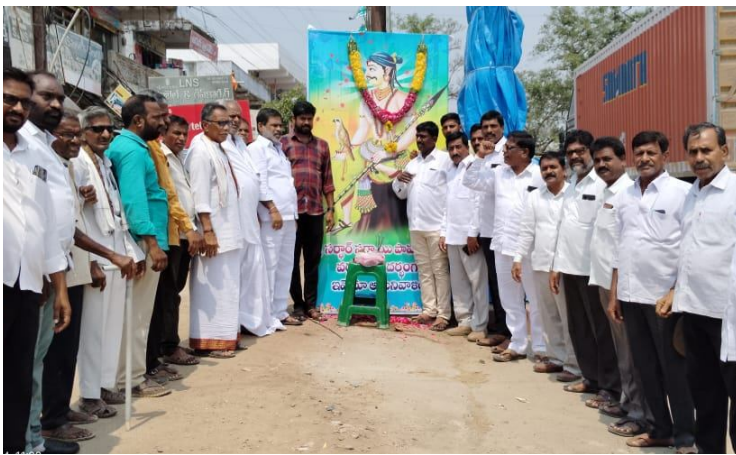
యాదాద్రి, ప్రభాతసూర్యుడు :

వలిగొండ పట్టణ కేంద్రంలోని రాజీవ్ గాంధీ చౌరస్తాలో పట్టణ గౌడ సంఘం ఆధ్వర్యంలో మంగళవారం సర్దార్ సర్వాయి పాపన్న గౌడ్ చిత్రపటానికి పూలమాలలు వేసి నివాళులర్పించి 314వ వర్ధంతి వేడుకలు ఘనంగా నిర్వహించారు ఈ సందర్భంగా వారు మాట్లాడుతూ సర్వాయి పాపన్న గౌడ్ తెలంగాణ శివాజీ అని గోల్కొండ కోటపై శ్రామికుల జెండా ఎగురవేసేందుకు ప్రతిన పూనిన ధైర్యశాలి అని తొలి తెలుగు బహుజన పక్రమర్తగా ఆయన చరిత్రలో నిలిచిపోయారని కులవ్యవస్థను ఏకం చేసి పోరాటం చేశారని వారి పోరాట సేవలను భవిష్యత్ తరాలకు తెలియజేయాలని వారన్నారు ఈ కార్యక్రమంలో గౌడ సంఘం అధ్యక్ష కార్యదర్శులు సంఘ సభ్యులు అభిమానులు తదితరులు పాల్గొన్నారు.