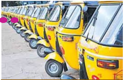
ఆటో బస్సుల్లో ఫ్రీ జర్నీ వల్ల తాము వీధిన పడ్డామని, కుటుంబ పోషణ భారమైందని ఆటో డ్రైవర్స్ ఆందోళన బాట పట్టారు. ఈ క్రమంలో ఆటో డ్రైవర్లను ఆదుకునేందుకు రాష్ట్ర ప్రభుత్వం ముందుకు వచ్చింది. ప్రతి ఆటో డ్రైవర్కు ఏడాదికి రూ. 12 వేల జీవన భృతి కల్పిస్తామని అసెంబ్లీ వేదికగా మంత్రి శ్రీధర్ బాబు ప్రకటించారు.

హరంగల్ - ప్రభాతసూర్యుడు : సిక్స్ గ్యారంటీస్ పథకాలతో అధికారంలోకి వచ్చిన కాంగ్రెస్ ప్రభుత్వం వెంటనే మహిళాకృషి పథకాన్ని అమలు చేసింది. మహిళలు, ట్రాన్స్జెండర్స్ తెలంగాణ వ్యాప్తంగా టీఎస్ ఆర్టీసీ బస్సుల్లో ఉచిత ప్రయాణం చేయడం ఈ పథకం ఉద్దేశం. అయితే ఈ పథకం ప్రారంభం నుంచి తీవ్ర విమర్శలు ఎదుర్కొంటుంది. అప్పుల్లో ఉన్న రాష్ట్రాన్ని ఇంకా లోటు బడ్జెట్లోకి నెడుతుందని రాజకీయ నాయకులు ఆరోపిస్తున్నారా ఫ్రీ టీకెట్ మూలంగా డబ్బులు చెల్లింకే మాకు సీట్లు దొరకడం లేదని పురుషులు అందోళన వ్యక్తం చేసిన సంఘటనలు అనేకం ఉన్నాయి. మరోవైపు మహిళలు ఉచిత ప్రయాణం కారణంగా ఆటోలు ఎవరూ ఎక్కుడం లేదని ఆటో డ్రైవర్లు రోడ్లకిన విషయం తెలిసింది. ఆటో బస్సుల్లో ఫ్రీ జర్నీ వల్ల తాము వీధిన పడ్డామని, కుటుంబ పోషణ భారమైందని ఆటో డ్రైవర్స్ సీఎం రేవంత్ రెడ్డికి వ్యతిరేకంగా అందోళనల బాట పట్టారు. వీరికి బీఆర్ఎస్, బీజేపీలు మద్దతు తెలిపిన విషయం తెలిసింది. ఈ క్రమంలో ఆటో డ్రైవర్లను ఆదుకునేందుకు రాష్ట్ర ప్రభుత్వం ముందుకు వచ్చింది. ప్రతి ఆటో డ్రైవర్కు ఏడాదికి రూ. 12 వేల జీవన భృతి కల్పిస్తామని అసెంబ్లీ వేదికగా మంత్రి శ్రీధర్ బాబు ప్రకటించారు. మంత్రి హిస్సం ప్రభాకర్ సైతం మీడియా ముఖంగా ఇదే విషయాన్ని చెప్పారు. అయితే ఏడాదికి రూ. 12 వేలు మనిషి జీవనానికి ఎలా సరిపోతాయని ఆటో డ్రైవర్లు ప్రశ్నిస్తున్నారు. రోజుకు రూ. 33 పడుతుందని ఆ డబ్బులతో కనీసం టీ కూడా వచ్చే పరిస్థితి