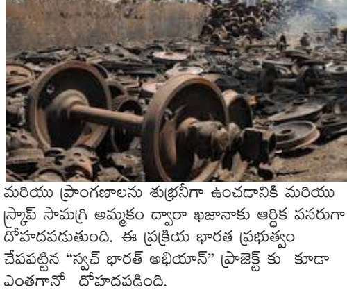
మరియు ప్రాంగణాలను శుభ్రంగా ఉంచడానికి మరియు స్కాప్ సామగ్రి అమ్మకం ద్వారా ఖజానాకు ఆర్థిక వనరుగా దోహదపడుతుంది. ఈ ప్రక్రియ భారత ప్రభుత్వం చేపట్టిన “స్వచ్ఛ భారత్ అభియాన్” ప్రాజెక్ట్ కు కూడా ఎంతగానో దోహదపడింది.

చేపట్టడంలో దక్షిణ మధ్య రైల్వే ముందంజలో ఉంది. భారతదేశ వ్యాప్తంగా ఇ-వేలం ప్రక్రియ కొనుగోలుదార్ల మధ్య పారదర్శకత మరియు వేలంలో పోటీతత్వాన్ని మెరుగుపరిచింది మరియు డిజిటల్ ఇండియా విధానంలో భాగంగా కారిత రహిత లాచాడవీలకు ఊతమిచ్చింది. ఈ పద్ధతి గతంలోనున్న మధ్యవర్తుల ప్రమేయాన్ని నివారించి ఈ వేలం ద్వారా పారదర్శకతను పెంపొందించడంతో కొనుగోలుదారుల నుండి వచ్చే ఫిర్యాదులను గణనీయంగా తగ్గించాయి. దక్షిణ మధ్య రైల్వే వెబ్ సైట్ లో మేనేజ్మెంట్ డిపార్ట్మెంట్ “ మిషన్ జీరో స్కాప్” ప్రాజెక్ట్ లక్ష్యాన్ని అమలు చేస్తూ తుక్కులు వెంటనే గుర్తించడంతో పాటు, ఒక నెల కంటే ఎక్కువ సమయం గాని లేదా ఒక ట్రక్ లోడ్ పరిమాణంలో స్కాప్ పేరుకుపోకుండా చర్చలు తీసుకోవడం, దీనివలన చర్చలు, వివిధ రైల్వే యూనిట్లు