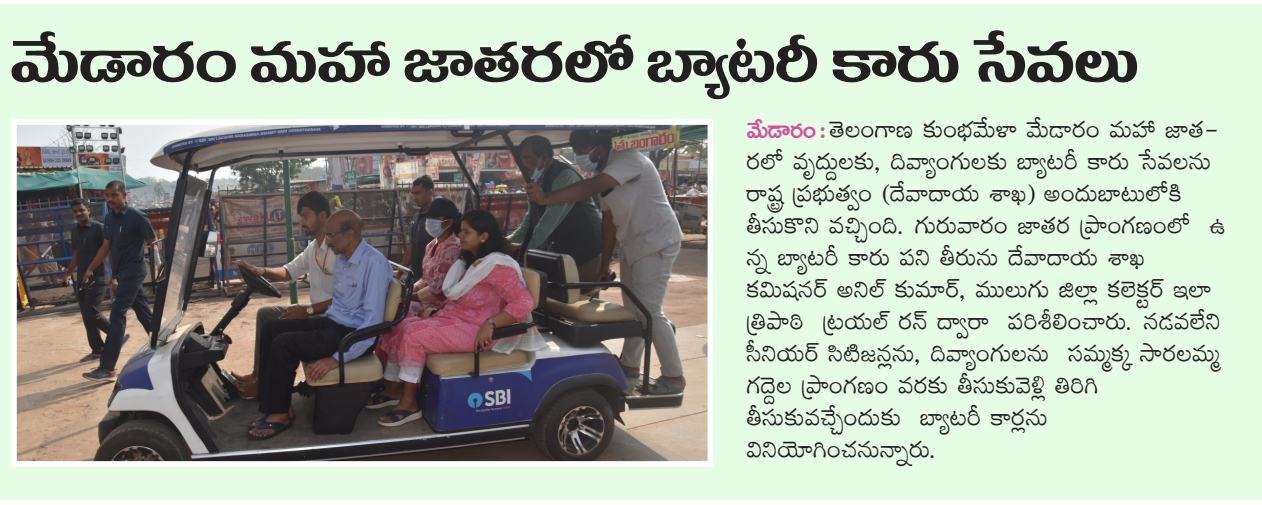
మేడారం: తెలంగాణ కుంభమేళా మేడారం మహా జాతరలో వృద్ధులకు, దివ్యాంగులకు బ్యాటరీ కారు సేవలను రాష్ట్ర ప్రభుత్వం (దేవదాయ శాఖ) అందుబాటులోకి తీసుకొని వచ్చింది. గురువారం జాతర ప్రాంగణంలో ఉన్న బ్యాటరీ కారు పని తీరును దేవదాయ శాఖ కమిషనర్ అనిల్ కుమార్, ములుగు జిల్లా కలెక్టర్ ఇలా త్రిపాఠి ట్రయల్ రన్ ద్వారా పరిశీలించారు. నడవలేని సీనియర్ సిటిజన్లను, దివ్యాంగులను సమ్మక్క సారమ్మ గద్దెల ప్రాంగణం వరకు తీసుకువెళ్లి తిరిగి తీసుకువచ్చేందుకు బ్యాటరీ కార్లను వినియోగించనున్నారు.