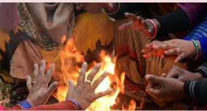
వరంగల్, హన్మకొండ, జనగాం, సిద్దిపేట, భువనగిరి, రంగారెడ్డి, హైదరాబాద్, మేడ్చల్, మల్కాజ్ గిరి, మెదక్ జిల్లాల్లో పొగ మంచు ఎక్కువగా ఉంటుందని పేర్కొంది. ఆ తర్వాత రోజుల్లో పొడి వాతావరణం ఏర్పడి అవకాశం ఉందని వెల్లడించింది.

బాద్, ఆసిఫాబాద్, మంచిర్యాల, నిర్మల్, కొత్తగూడెం, ఖమ్మం, నల్గొండ, సూర్యాపేట, మహబూబాబాద్, వరంగల్, హన్మకొండ, జనగాం, సిద్దిపేట, భువనగిరి, రంగారెడ్డి, హైదరాబాద్, మేడ్చల్, మల్కాజ్ గిరి, మెదక్ జిల్లాల్లో ఉదయం వేళల్లో అధికంగా పొగమంచు పరిస్థితులు ఉంటాయని తెలిపింది. ఇక ఆదివారం ఆదిలాబాద్, ఆసిఫాబాద్, మంచిర్యాల, నిర్మల్, కొత్తగూడెం, ఖమ్మం, నల్గొండ, సూర్యాపేట, మహబూబాబాద్,