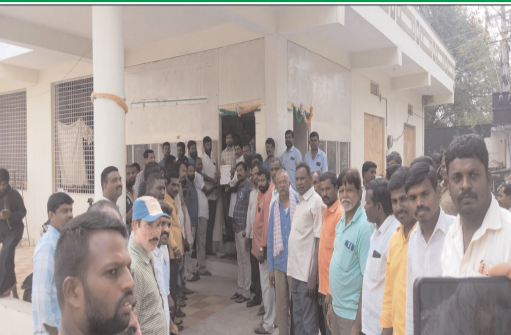
ఇబ్రహీంపట్నం తహసీల్దార్ కార్యాలయంలో అధికారులకు రెవెన్యూ పత్రాన్ని అందజేస్తున్న ఆటో యూనియన్ నాయకులు

- ప్రభుత్వ సంక్షేమ పథకాలను అన్ని వర్గాల వారికి అందేలా చూడాలి - జేపీసీ చైర్మన్ మడుపు వేణుగోపాలరావు