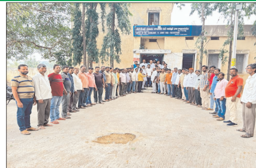
మంచాల మండలం రెవెన్యూ అధికారులకు వినతి పత్రాన్ని అందజేస్తున్న యూనియన్ నాయకులు