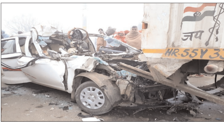
ఉత్తరప్రదేశ్- ప్రభాత సూర్యుడు

ఉత్తరప్రదేశ్ లోని భోజిపురాలో తీరని విషాదం నెలకొంది. కారు-ట్రక్కు ఢీకొన్న ఘటనలో చిన్నారి సహా 8 మంది సజీవ దహనమయ్యారు. బాధితులు ఓ వివాహానికి హాజరై వస్తుండగా శనివారం రాత్రి బరేలీ జాతీయ రహదారిపై జరిగింది ఘటన. ప్రమాదం తర్వాత కారు సెంట్రల్ లాక్ పడిపోవడంతో లోపలున్నవారు తప్పించుకునే మార్గం లేకుండా పోయింది. కారు ట్రైరు పేలిపోవడంతో అదుపుతప్పి అవతలి రోడ్డులో ఉత్తరాఖండ్ నుంచి ఇసుకతో వస్తున్న ట్రక్కును ఢీకొట్టి సుజ్జనుజ్జ అయింది. కారును ట్రక్కు కొంతదూరం ఈడ్చుకెళ్లడంతో మంటలు చెలరేగాయి. కారుడోర్లు లాక్ కావడంతో లోపల ఉన్నవారు తప్పించుకోలేకపోయారు. మంటల్లో అందరూ సజీవ దహనమయ్యారు. సమాచారం అందుకున్న పోలీసులు వెంటనే ఘటనా స్థలానికి చేరుకున్నారు. కారు నుంచి చిన్నారి సహా ఏడుగురి మృతదేహాలను బయటకు తీశారు. బాధితులను గుర్తించి వారి కుటుంబ సభ్యులకు సమాచారం ఇచ్చేందుకు ప్రయత్నిస్తున్నట్లు పోలీసులు తెలిపారు.