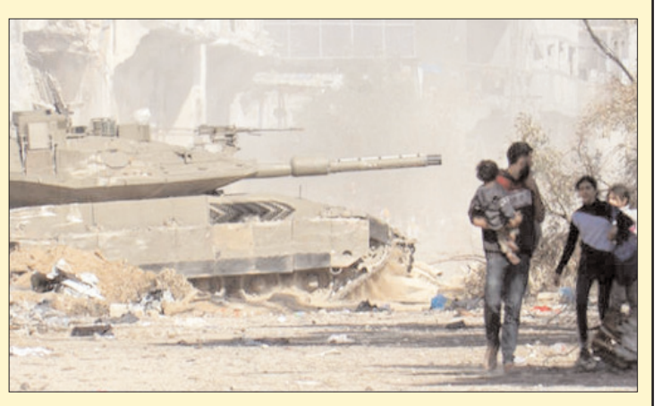
ఇజ్రాయిల్ - ప్రభాత సూర్యుడు

కాల్పుల విరమణ అనంతరం హమాస్ పై దాడులను ఇజ్రాయిల్ మళ్లీ మొదలుపెట్టింది. ఇందుకు కాల్పుల విరమణ ఒప్పందాన్ని హమాస్ ఉల్లంఘించిందనే నెపాన్ని హమాస్ పైన ఇజ్రాయిల్ మోపుతోంది. కాల్పుల విరమణ కాల పరిమితి తరువాత తాను తిరిగి దాడులను పునఃప్రారంభిస్తానని ఇజ్రాయిల్ పదేపదే ప్రకటిస్తోంది. హమాస్ కాల్పుల విరమణను ఉల్లంఘించి తమ భూభాగంపైన కాల్పులకు తెగబడిందని ఆరోపించటమే కాకుండా గాజాలోని హమాస్ స్థావరాలపైన దాడులను మొదలెట్టిందని కూడా ఇజ్రాయిల్ ఆ ప్రకటనలో పేర్కొంది. అంతేకాకుండా గాజాలోని హమాస్ లక్ష్యాలుపైన వైమానిక దాడులను మొదలెట్టినట్లు కూడా ఇజ్రాయిల్ సైన్యం ప్రకటించింది. ఇజ్రాయిల్ సైన్యమే కాకుండా ప్రధాన మంత్రి నేతాన్యాయ కూడా హమాస్ కాల్పులు విరమణ ఒప్పందాన్ని ఉల్లంఘించిందని, బంధీలుగా