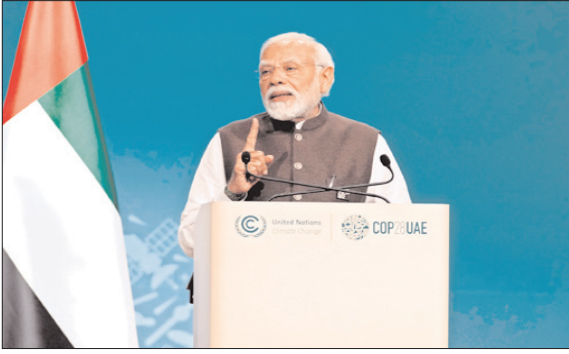
న్యూఢిల్లీ - ప్రభాత సూర్యుడు

వర్ధమాన దేశాలకు సాంకేతిక బదిలీ జరగాలని, వాతావరణ విపత్తులను ఎదుర్కొనేందుకు అవసరమైన నిధులను అందించేలా చూడాలని ప్రధాని నరేంద్ర మోడీ సంపన్న దేశాలకు పిలుపిచ్చారు. వాతావరణ సమస్యలను సృష్టించడంలో వర్ధమాన దేశాల పాత్ర వుండడం లేదని, అయినా కూడా వారు సమస్య పరిష్కారంలో భాగస్వాములవడానికి సుముఖత వ్యక్తం చేస్తున్నారన్న విషయాన్ని గుర్తించాల్సి వుందన్నారు. సమానత్వం, వాతావరణ న్యాయం, పరస్పరం పంచుకునే బాధ్యతలు, సామర్థ్యాల ప్రాతిపదికన వాతావరణ కార్యాచరణ వుండాలని తాను విశ్వసిస్తానని చెప్పారు. ఈ సూత్రాలకు కట్టుబడి వుండడం ద్వారా