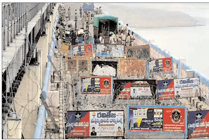
హైదరాబాద్ - ప్రభాత సూర్యుడు

తెలుగు ప్రజల ప్రతిష్టాత్మక ప్రాజెక్టు సాగర్ను సాగర్ కేంద్రం గుప్పిట్లోకి వెళ్లిపోయింది. ఇప్పటిదాకా వివాదాలను పరస్పరం చర్చించి, పరిష్కరించుకునే అవకాశం ఉండగా ఇక నుండి కేంద్రం కన్నునన్నట్లనే వ్యవహరించాల్సిన పరిస్థితి ఏర్పడింది. ద్యామ్ రక్షణతో పాటు, నీటి విడుదలను కూడా కేంద్రం తన పరిధిలోకి తీసుకుంది. దీంతో ప్రతి చిన్న అవసరానికి కేంద్రం మీద ఆధారపడాల్సిన పరిస్థితి తెలుగురాష్ట్రాలకు ఏర్పడింది. ఈ మేరకు కేంద్ర హోమ్ మంత్రిత్వ శాఖ శుక్రవారం చేసిన ప్రతిపాదనలను రెండు రాష్ట్ర ప్రభుత్వాలు