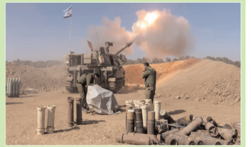
గాజా - ప్రభాత సూర్యుడు

గాజాలో గత నాలుగు రోజులుగా అమలవుతున్న కాల్పుల విరమణను మరో 48గంటలు పాడిగించారు. ఇరు పక్షాలు ఇందుకు అంగీకరించాయని మధ్యవర్తి ఖతార్ తెలిపింది. దీంతో ఇరు పక్షాల అధీనంలో వున్న బందీలు మరింత మంది విడుదలవుతారనే ఆశలు నెలకొన్నాయి. మరోవైపు కాల్పుల విరమణ మరింతగా పాడిగించే అవకాశాలు వుండవచ్చనే అంచనాలు, ఆశలు కూడా పెరిగాయి. దీనివల్ల గాజాలోకి మరింతగా మానవతా సాయం అందుతుంది. కాగా, నాల్గవ రోజు బందీల మార్పిడిలో భాగంగా 33మంది