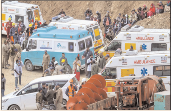
ఉత్తరాఖండ్ - ప్రభాత సూర్యుడు

ఉత్తరాఖండ్ లో నవంబరు 12న ఓ టన్నెల్ కాలిపోగా, 17 రోజుల పాటు ప్రాణాలు అరచేతిలో పెట్టుకుని టన్నెల్ లోనే చిక్కుకుపోయిన 41 మంది కార్మికులను ఎట్టకేలకు సురక్షితంగా బయటికి తీసుకువచ్చారు. అధికారులు, సిబ్బంది వడిన శ్రమకు ఫలితం దక్కింది. కార్మికుల రెస్క్యూ ఆపరేషన్ సుఖాంతం కావడంతో అందరూ ఊపిరి పీల్చుకున్నారు. రాష్ట్రపతి ద్రౌపది