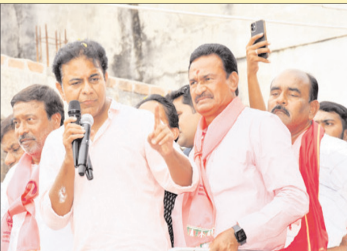
కామారెడ్డి - ప్రభాత సూర్యుడు

-బీఆర్ఎస్ రాష్ట్ర వర్కింగ్ ప్రెసిడెంట్ కేటీఆర్