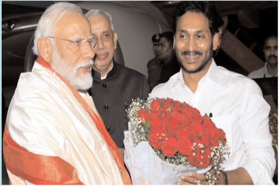
తిరుపతి - ప్రభాత సూర్యుడు

తిరుమల రెండు రోజుల పర్యటనలో భాగంగా ప్రధాన మంత్రి నరేంద్ర మోదీ ఆదివారం రాత్రి 7.35 గంటలకు తిరుపతి ఎయిర్ పోర్టుకు చేరుకున్నారు. ఆయనకు రాష్ట్ర గవర్నర్ అబ్దుల్ గఫూర్ అహ్మద్, ముఖ్యమంత్రి వైఎస్ జగన్మోహన్ రెడ్డి పుష్పగుచ్ఛం ఇచ్చి స్వాగతం పలికారు. అక్కడి నుంచి ప్రధాని రోడ్డు మార్గం గుండా తిరుమలలోని రచన అతిథి గృహానికి 8.25 గంటలకు చేరుకున్నారు. ఆయనకు టిటిడి అధికారులు ప్రత్యేక బస్ ఏర్పాట్లు చేశారు. ప్రధాని పర్యటన నేపథ్యంలో తిరుమల, తిరుపతిని రెండు రోజులపాటు ఎన్ఎజి కంట్రోల్ లోకి తీసుకుంది. మూడు వేల మంది భద్రతా సిబ్బంది బందోబస్తు, అడుగుడునా భద్రతా