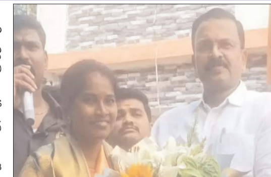
ఎన్నికల బరిలో నిలబడటం గొప్ప సాహసమన్నారు.

రాజకీయాలు మారాలన్నా.. సమాజం బాగుపడాలన్నా.. రాష్ట్రం, దేశం ఆర్థికంగా అభివృద్ధి చెందాలన్నా.. యువత చట్ట సభల్లో అడుగు పెట్టాలని