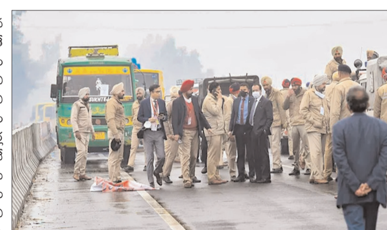
నిర్మాణలో లోపాలున్నట్లు సుప్రీంకోర్టుకు నివేదిక సమర్పించింది.