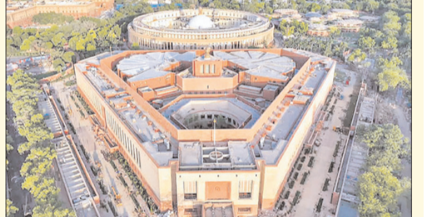
"క్యాష్ ఫర్ క్యూరీ" ఆరోపణలపై ఎఫ్ఐక్స్ కమిటీ నివేదికను లోక్ సభ సెషన్లో ప్రవేశపెట్టనున్నారు. ప్యానెల్ సిఫారసు

పార్లమెంట్ శీతాకాల సమావేశాల సందర్భంగా డిసెంబర్ 2న ప్రభుత్వం అఖిలపక్ష సమావేశాన్ని ఏర్పాటు చేసింది. సమావేశాలు డిసెంబర్ 4న ప్రారంభమై డిసెంబర్ 22న ముగుస్తాయి. సమావేశం ప్రారంభానికి ఒక రోజు ముందు అఖిలపక్ష సమావేశాన్ని ఏర్పాటు చేస్తారు. కానీ డిసెంబర్ 3న ఎన్నికలు జరుగుతున్న ఐదు రాష్ట్రాల ఓట్ల లెక్కింపు కారణంగా ఈసారి అది ఒక రోజు ముందుకు అఖిల పక్ష సమావేశం నిర్వహిస్తున్నారు. అసెంబ్లీ ఎన్నికల ఫలితాలు కీలక బిల్లలను ఆమోదించడానికి ప్రభుత్వం ఆసక్తిగా ఉంది. టీఎంసీ ఎంపీ మహువా మొయిత్తాపై చచ్చిన