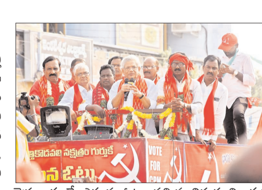
నెహ్రూ కంటే ఎక్కువ ఓట్లు వచ్చిన విషయాన్ని గుర్తు చేశారు.

సాయుధ తెలంగాణ పోరాట స్ఫూర్తితో అసెంబ్లీ ఎన్నికల్లో సీపీఐ(ఎం) అభ్యర్థులను గెలిపించాలని ఆ పార్టీ అఖిల భారత ప్రధానకార్యదర్శి సీతారాంవిచార