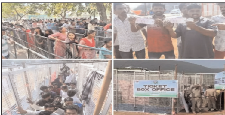
విశాఖ - ప్రభాత సూర్యుడు

ఈ నెల 23న విశాఖలోని మధురవాడ స్టేడియంలో టీమిండియా, ఆస్ట్రేలియా జట్లు టీ20 మ్యాచ్ లో తలపడనున్నాయి. ఈ మ్యాచ్ కోసం నేడు ఆఫ్ లైన్ విధానంలో టికెట్ల అమ్మకం ప్రారంభమైంది. ఈ ఉదయం 10 గంటల నుంచి టికెట్ల అమ్మకం పురూ చేశారు. మధురవాడ స్టేడియంలో పాలు మున్సిపల్ స్టేడియం, గాజువాక ఇండోర్ స్టేడియంలోనూ టికెట్ల అమ్మకాలు జరుగుతున్నాయి. రూ.600, రూ.1500, రూ.2000, రూ.3000, రూ.3500 ధరల శ్రేణిలో టికెట్ల విక్రయాలు చేపట్టారు. వరల్డ్ కప్ ముగిసాక టీమిండియా, ఆసీస్ మధ్య 5 మ్యాచ్ ల టీ20 సిరీస్ జరగనుంది. ఈ సిరీస్ లోని తొలి మ్యాచ్ కు విశాఖ ఆతిథ్యమిస్తోంది. నవంబరు 23 నుంచి డిసెంబరు 3 వరకు సిరీస్ జరగనుంది.