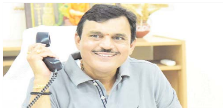
సంగారెడ్డి- ప్రభాత సూర్యుడు