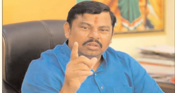
హైదరాబాద్ - ప్రభాత సూర్యుడు