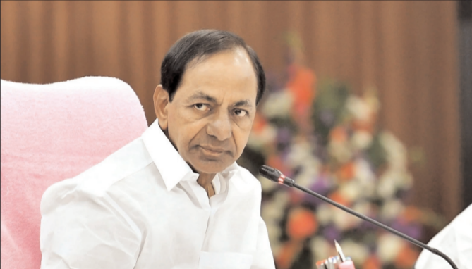
హైదరాబాద్ - ప్రభాత సూర్యుడు

తెలంగాణ సీఎం కేసీఆర్ అనారోగ్యం నుంచి వేగంగా కోలుకుంటున్నారు. త్వరలోనే ఎన్నికల ప్రచారానికి శ్రీకారం చుట్టనున్నారు. బీఆర్ఎస్ అధినేత కేసీఆర్ అనారోగ్యం నుంచి కోలుకుని ఎన్నికల ప్రచారం మొదలుపెట్టేందుకు ప్లాన్ చేశారు. ఈ మేరకు కేసీఆర్ ఎన్నికల ప్రచార షెడ్యూల్ ను బీఆర్ఎస్ విడుదల చేసింది. అక్టోబర్ 15న హుస్సేన్ సాదా నుంచి కేసీఆర్ ఎన్నికల శంఖారావం పూరించనున్నారు. నవంబర్ 9న కేసీఆర్ నామినేషన్ వేయనున్నారు. గజ్వీల్ లో మధ్యాహ్నం 1 - 2 గంటల మధ్య నామినేషన్, అదే రోజు మధ్యాహ్నం 2- 3 గంటలకు కామారెడ్డిలో నామినేషన్ వేసిన అనంతరం సాయంత్రం 4 గంటలకు కామారెడ్డిలో కేసీఆర్ భారీ బహిరంగ సభ నిర్వహించనున్నారు.