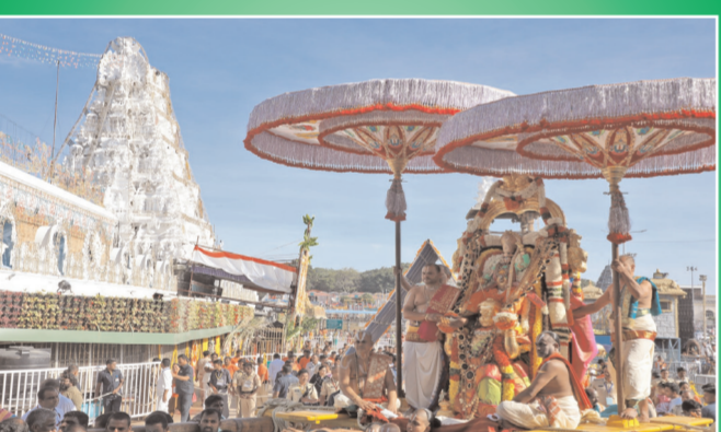
తిరుమల - ప్రభాత సూర్యుడు

శ్రీవారి సాలకట్ల బ్రహ్మాంశువాల్లో భాగంగా ఆరో రోజు శనివారం ఉదయం 8 నుండి 10 గంటల వరకు శేషాచలాధీశుడు శ్రీ కోదండ రాముని అవతారంలో ధనుస్సు, బాణం ధరించి తన భక్తుడైన హనుమంతునిపై ఊరేగి భక్తులకు దర్శనమిచ్చారు. వాహనం ముందు భక్తజన బృందాలు చెక్కబజనలు, కోలాటాలతో స్వామివారిని కీర్తిస్తుండగా.. మంగళవాయిద్యాల నడుమ స్వామివారి వాహనసేవ కోలాహలంగా జరిగింది. భక్తులు ఆడుగుడుగునా కర్పూర హారతులు