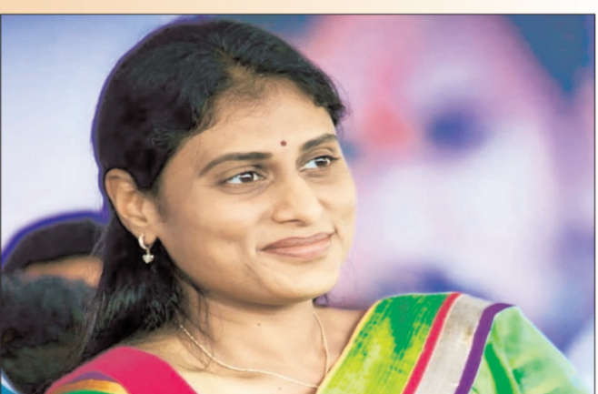
హైదరాబాద్ - ప్రభాత సూర్యుడు

కాంగ్రెస్ పార్టీలో వైఎస్ఆర్ తెలంగాణ పార్టీ విలీనంపై పర్సెల ఏదో ఒకటి తేల్చుకోవాలనుకుంటున్నారు. ఓ వైపు కాంగ్రెస్ టికెట్ల కనరత్తు పూర్తవుతోంది. కమ్యూనిస్టులతో పొత్తులపైనా చర్చిస్తున్నారు. కానీ పర్సెల పార్టీ గురించి మత్రం ఎలాంటి స్పందన వ్యక్తం చేయడం లేదు. దీంతో పర్సెల ఏదో ఓ విషయం తేల్చుకోవాలని ఢిల్లీ వెళు స్పట్లు?గ తెలుస్తోంది. ఇటీవల సీడబ్ల్యూసీ సమావేశాల సందర్భంగా హైదరాబాద్లో కర్ణాటక డిప్యూటీ సీఎం డీకే శివకుమార్తో పర్సెల భేటీ అయ్యారు. వైఎస్సార్ టీపీ విలీనంకు సంబంధించి ఆయన మధ్యవర్తిత్వం వహిస్తున్నారు. ఆయన కూడా ఏమీ