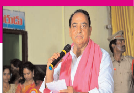
నిర్మల్ - ప్రభాత సూర్యుడు

నిర్మల్ మున్సిపాలిటీ అభివృద్ధికి ప్రభుత్వం రూ. 50 కోట్ల టి.యు.ఎఫ్.ఐ.డి.సి నిధులను కేటాయించిందని అటవీ, పర్యావరణ, న్యాయ, దేవాదాయశాఖ మంత్రి ఇంద్రకరణ్ రెడ్డి తెలిపారు. నిర్మల్ పట్టణాభివృద్ధికి రూ. 50 కోట్ల ప్రత్యేక నిధులు మంజూరు చేసిన ముఖ్యమంత్రి కేసీఆర్, మంత్రి కేటీఆర్ కు ప్రజల తరఫున కృతజ్ఞతలు చెప్పారు. నిర్మల్ మున్సిపల్ కార్యాలయ ప్రాంగణంలో బీఆర్ఎస్ శ్రేణులు, స్థానిక ప్రజాప్రతినిధులతో కలిసి మంత్రి ఇంద్రకరణ్ రెడ్డి.. సీయం కేసీఆర్, మంత్రి కేటీఆర్ చిత్రపటాలకు క్షీరాభిషేకం చేశారు. ఈ సందర్భంగా మంత్రి ఇంద్రకరణ్ రెడ్డి మాట్లాడుతూ సీయం కేసీఆర్, పురపాలక శాఖ మంత్రి కేటీఆర్ ఆడిగిన వెంటనే నిర్మల్ పట్టణ అభివృద్ధికి రూ. 50 కోట్ల నిధులను కేటాయించారు. నిర్మల్ పట్టణాభివృద్ధికి నిధులు మంజూరు చేయడం సంతోషంగా ఉంది. ప్రత్యేక నిధులు మున్సిపాలిటీ అభివృద్ధికి ఎంతో ఊతమిస్తాయి.