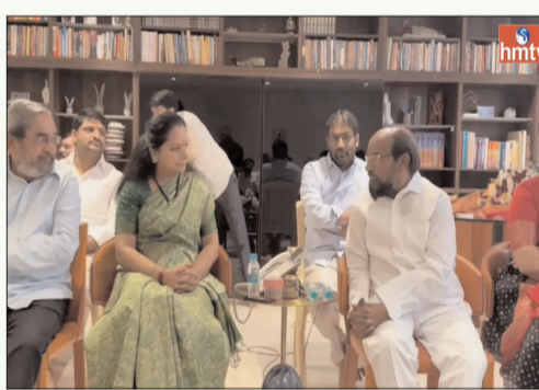
హైదరాబాద్ - ప్రభాత సూర్యుడు

చట్టసభల్లో బీసీ మహిళలకు, బీసీలకు రిజర్వేషన్లు కల్పించడంతోపాటు కులగణన చేపట్టాలన్న డిమాండ్ తో ఈనెల 26వ తేదీన జలవిహారాల్లో బీసీ సంఘాలు ఏర్పాటు చేసిన సమావేశానికి పూర్తిగా మద్దతు ఇస్తున్నామని బీఆర్ఎస్ ఎమ్మెల్సీ కల్వకుంట్ల కవిత ప్రకటించారు. శనివారం రోజున వైఎస్ఆర్ సీపీ ఎంపీ, బీసీ సంక్షేమ సంఘం జాతీయ అధ్యక్షుడు