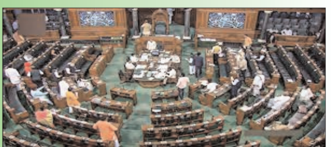
న్యూఢిల్లీ - ప్రభాత సూర్యుడు

అవిశ్వాస తీర్మానంపై చర్చకు 2 రోజుల్లో 16 గంటల సమయం