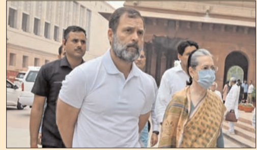
న్యూఢిల్లీ - ప్రభాత సూర్యుడు

కాంగ్రెస్ నేత రాహుల్ గాంధీ లోక్ సభ సభ్యత్వం పునరుద్ధరణ అయిన తర్వాత నూతనోత్సాహంతో మంగళవారం ఉదయం పార్లమెంటుకు బయల్దేరారు. ప్రధాన మంత్రి నరేంద్ర మోదీ నేతృత్వంలోని కేంద్ర ప్రభుత్వంపై కాంగ్రెస్ సహా ప్రతిపక్షాలు ప్రతిపాదించిన అవిశ్వాస తీర్మానంపై చర్చను ఆయన ప్రారంభించబోతున్నారు. ఆయన మోదీ ప్రభుత్వ వైఫల్యాలను గట్టిగా ఎండగట్టబోతున్నారు. కాంగ్రెస్ వర్గాలు తెలిపిన సమాచారం ప్రకారం, అవి శ్వాస తీర్మానంపై చర్చను రాహుల్ గాంధీ