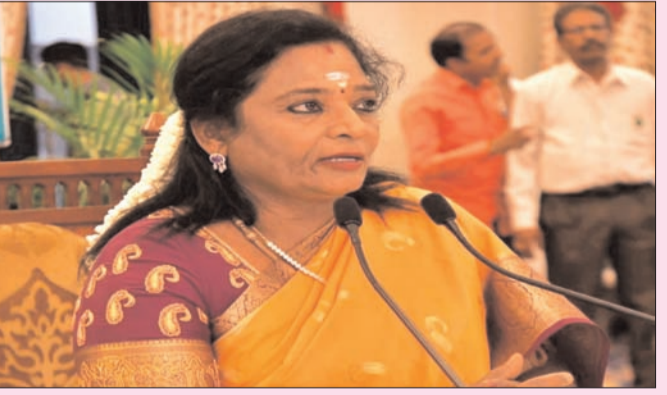
హైదరాబాద్ - ప్రభాత సూర్యుడు

తెలంగాణ ప్రభుత్వం - గవర్నర్ తమిళిసై మధ్య పరిస్థితి ఉప్పు - నిప్పులా ఉంది. విమర్శలు, ప్రతివిమర్శలతో రెండు రాజ్యాంగ వ్యవస్థలు ఘర్షణ పడుతున్న సంగతి తెలిసిందే. తాజాగా రాష్ట్ర ప్రభుత్వం ప్రతిపాదించిన పలు బిల్లులపై గవర్నర్ చర్చ వార్తల్లో నిలిచింది. ఆర్డీసీ బిల్లులపై ప్రశ్నలు లేవనెత్తడం సహా ఆర్డీసీ ఉన్నతాధికారులతో ప్రత్యేకంగా సమావేశం నిర్వహించడం వంటివి జరిగాయి. గవర్నర్ తీరుపై రాష్ట్ర ప్రభుత్వ పెద్దలు గురుగా ఉన్నారు. ఈ సమయంలోనే గవర్నర్ కీలక నిర్ణయం తీసుకున్నారు. చాలా