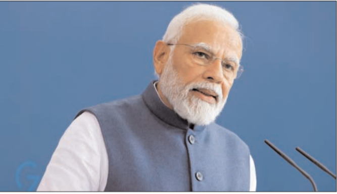
న్యూఢిల్లీ - ప్రభాత సూర్యుడు

సామాజిక న్యాయం గురించి మాట్లాడే అర్హత ఇండియా కూటమి పక్షాలకు లేదు నిన్న రాజ్యసభలో సెమి పైన్స్ లో ఇండియా కూటమి పరాజయం విపక్ష కూటమి ఇండియా పై ప్రధాని మోదీ కీలక వ్యాఖ్యలు