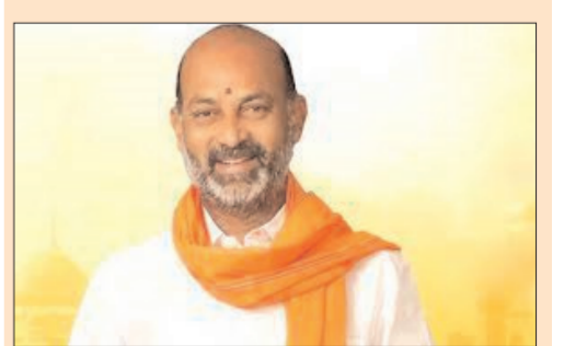
విజయవాడ - ప్రభాత సూర్యుడు