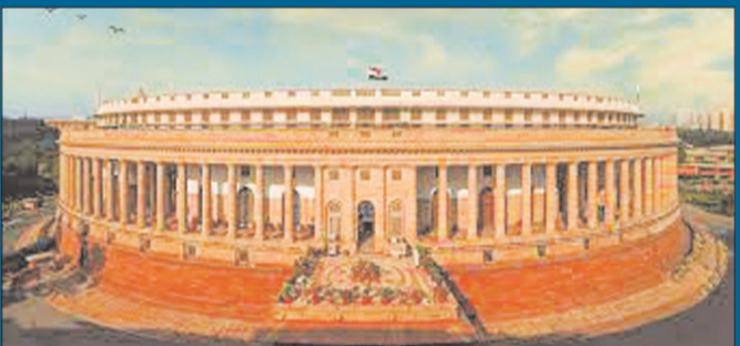
న్యూఢిల్లీ - ప్రభాత సూర్యుడు

పార్లమెంట్ వర్షాకాల సమావేశాలు ముగిశాయి. జూలై 20న ప్రారంభమైన పార్లమెంట్ వర్షాకాల సమావేశాలు 23 రోజుల పాటు 17 సిట్టింగ్ లు నిర్వహించి శుక్రవారం మిగతా 2లో..