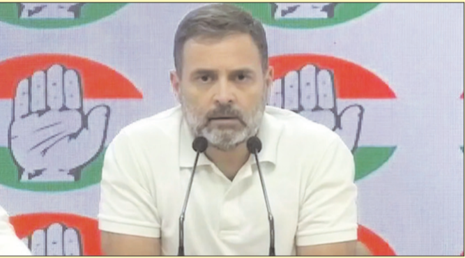
న్యూఢిల్లీ - ప్రభాత సూర్యుడు

నెలల తరబడి మణిపూర్ మండుతుంటే ఈ అంశంపై చర్చకు సమాధానమిచ్చే సందర్భంలో ప్రధాని నవ్వులు చిందిస్తూ, జోకలు వినరడాన్ని కాంగ్రెస్ నేత రాహుల్ గాంధీ తప్పుపట్టారు. ప్రధాని హఠాత్తుగా ఇది తగదన్నారు. శుక్రవారం నాడిక్యూడ ఎఐసిసి కార్యాలయంలో ఏర్పాటు చేసిన విలేకరుల సమావేశంలో రాహుల్ గాంధీ మాట్లాడుతూ, మణిపూర్లో భరత మాతను ప్రధాని మోడీ, హంపంత్రి