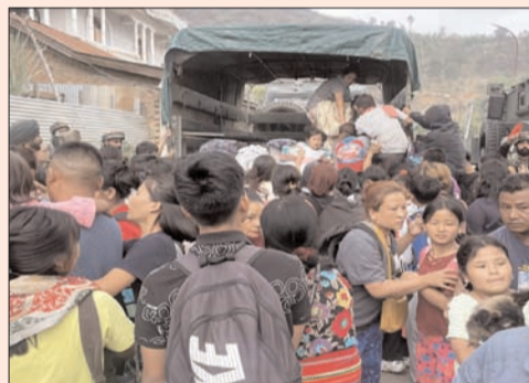
ఇంపాల్ - ప్రభాత సూర్యుడు

మణిపూర్ లో హింసను తట్టుకోలేక చాలా మంది రాష్ట్రం వదిలి వెళ్లిపోతున్నారు. వక్క రాష్ట్రాలకు వలస వెళ్తున్నారు. మిజోరాంకి వేలాది మంది వలస వెళ్తున్నట్లు సమాచారం. ఈ క్రమంలోనే 5 వేల మంది కుకీలు భయంతో మణిపూర్ ని వదిలి నాగాలాండ్ కి వెళ్లారు. అక్కడే ఆశ్రయం పొందుతున్నారు. అయితే...అక్కడ ప్రత్యేకంగా వీళ్ల కోసం అంటూ రిలీఫ్ క్యాంప్ లు ఏమీ లేవు. ఫలితంగా...ఎక్కడో ఓ మారుమూల గ్రామంలో తలదాచుకుంటున్నారు.