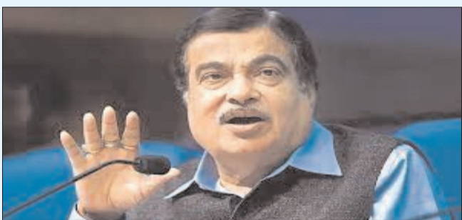
ముంబై - ప్రభాత సూర్యుడు

కమిషన్ తీసుకున్నారని ఎఫ్ఐసా లంటే రాజకీయాల నుంచి తక్షణం రిటైర్ అవుతా