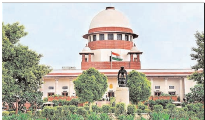
న్యూఢిల్లీ - ప్రభాత సూర్యుడు

బాధిత మహిళలకు సత్వర న్యాయం అందేలా చూడాలి కేంద్రాన్ని నిలదీసిన సుప్రీంకోర్టు