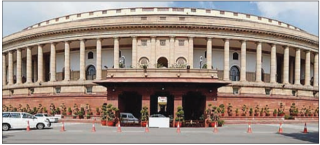
న్యూఢిల్లీ - ప్రభాత సూర్యుడు