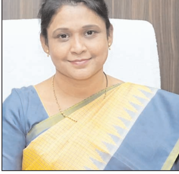
జగిత్యాల - ప్రభాత సూర్యుడు

వర్షాల వలన దెబ్బతిన్న ప్రాంతాలలో మరమ్మతులు, పునరావాస కార్యక్రమాలు, నష్టపోయిన వాటికి ప్రతిపాదనలు సిద్ధం చేయాలని సంబంధిత అధికారులను జిల్లా కలెక్టర్ షేక్ యాస్మీన్ బాషా ఆదేశించారు.శుక్రవారం రోజున క్యాంపు కార్యాలయం నుండి జిల్లాలోని వివిధ శాఖల అధికారులతో బెలి కాన్ఫరెన్సు నిర్వహించారు. ఈ సందర్భంగా కలెక్టర్ మాట్లాడుతూ గత 3 రోజుల నుండి జిల్లాలో కురిసిన భారీ వర్షాల నేపథ్యంలో గ్రామాలు, పట్టణాల్లోని లోతట్టు ప్రాంతాలు, కాలనీలు, వీధుల్లో వర్షపు నీటితో రోడ్లు, మురికి కాలువల్లో నీటి నిల్వలు చేరడం జరిగాయని, వాటిని తొలగించే పనులు చేపట్టి వ్యాధులు ప్రబలకుండా రసాయనాలు స్ప్రే చేయాలని అన్నారు. వివిధ గ్రామాలు, పట్టణాలకు వెళ్ళే రహదారులను పరిశీలించి దెబ్బతిన్న రోడ్లు, కల్వర్టులను పరిశీలించి ప్రత్యామ్నాయ ఏర్పాట్లు రవాణాకు అంతరాయం కలుగకుండా చేపట్టాలని అన్నారు. పంచాయతీ రాజ్, రోడ్లు భవనాలు, జాతీయ రహదారుల ఇంజనీరింగ్ అధికారులు వారి అధీనంలోని రోడ్ల పరిస్థితులు పరిశీలించి దెబ్బతిన్న ప్రాంతాలలో ఎన్జిఎంట్ లు తయారు చేయాలని సూచించారు. విద్యుత్ సరఫరాలో అంతరాయాలు కలుగకుండా ఏర్పాట్లు చేయాలని, దెబ్బతిన్న విద్యుత్ పోల్స్ సరిచేయాలని