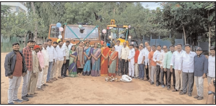
నూతన జెసిబి, జెడ్పింగ్ వాహనాలను ప్రారంభిస్తున్న చైర్మన్ చెవుల స్వప్న తదితరులు