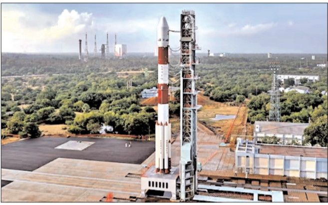
నెల్లూరు - ప్రభాత సూర్యుడు