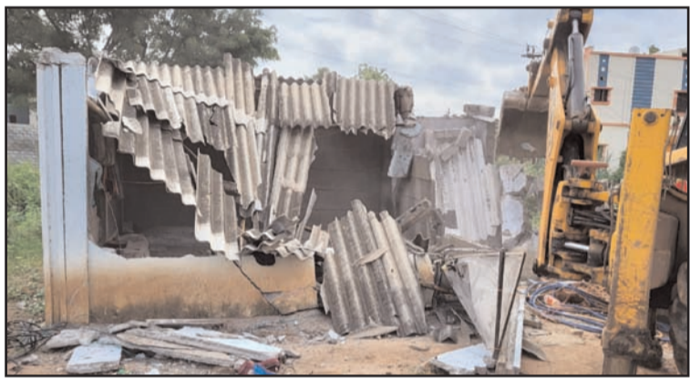
పసుమాముల సర్వే నెంబర్ 444లో నిర్మించిన అక్రమ కట్టడాలను కూల్చివేస్తున్న అధికారులు