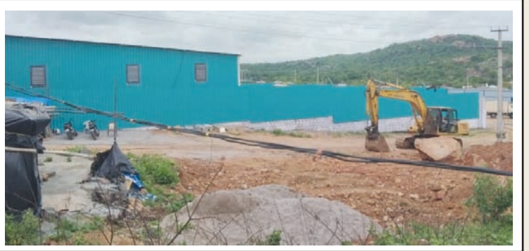
4వ వార్డు సంపూర్ణ హెబాటల్ సమీపంలో అనుమతులు లేకుండా నిర్మిస్తున్న వ్యాపార సముదాయం, 4వ వార్డు పరిధి విజయవాడ