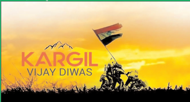
న్యూఢిల్లీ - ప్రభాత సూర్యుడు

జూలై 26, 1999న పాకిస్తాన్ సైన్యంపై భారత సైన్యం విజయం సాధించిన రోజు కార్గిల్ యుద్ధంలో వీర మరణం పొందిన అమరవీరులకు ఆశ్రు నివాళులు