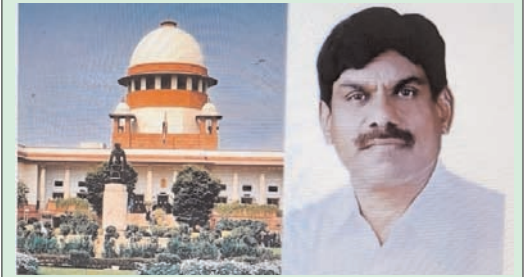
న్యూఢిల్లీ - ప్రభాత సూర్యుడు