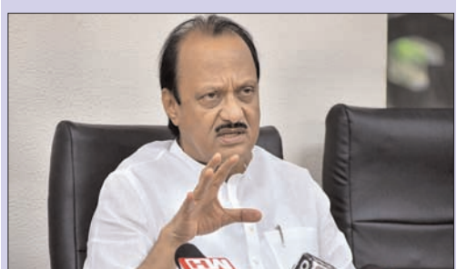
ముంబై - ప్రభాత సూర్యుడు

మహారాష్ట్ర రాజకీయాలు రసవత్తరంగా సాగుతున్నాయి. పార్టీలపై నేతల తిరుగుబాటుతో ఇప్పటికే మహారాజకీయాలు సంచలనంగా మారాయి. నేషనలిస్ట్ కాంగ్రెస్ పార్టీని రెండు ముక్కలుగా చీల్చిన అజిత్ పవార్ తన వర్గం ఎమ్మెల్యేలతో కలిసి