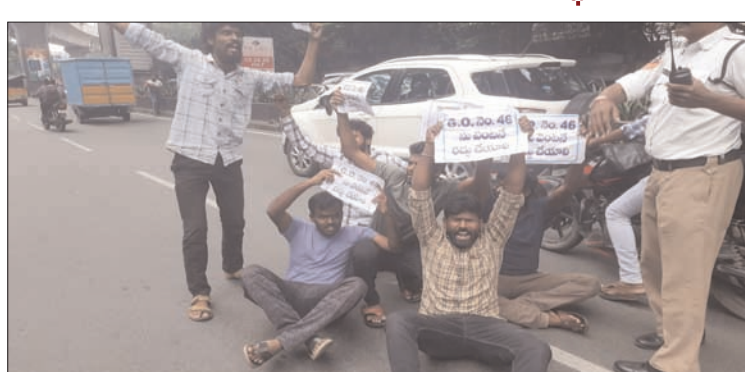
హైదరాబాద్ - ప్రభాత సూర్యుడు

లకడికావులోని డీజీపీ కార్యాలయాన్ని కానిస్టేబుల్ అభ్యర్థులు సోమవారం ముట్టడించారు. రోడ్డు పై బైఠాయించడంతో భారీగా ట్రాఫిక్ జామ్ ఏర్పడింది. వారిని పోలీసులు అరెస్టు చేసారు. ఈనేపథ్యంలో ఇరువురికి తోపులాట, వాగ్వివాదం జరగడంతో ఉద్రిక్తత నెలకొంది. 2022 నోటిఫికేషన్ లో కానిస్టేబుల్ నియామకాల్లో తీసుకువచ్చిన జీవో నెంబర్ 46 రద్దు చేయాలని డిమాండ్ చేసారు. పాత పద్ధతిలో నియమాలను చేపట్టి... గ్రామాణ ప్రాంత విద్యార్థులకు న్యాయం చేయాలని... జీవో 46 వల్ల తీవ్రమంగా నష్టపోతామని అన్నారు.