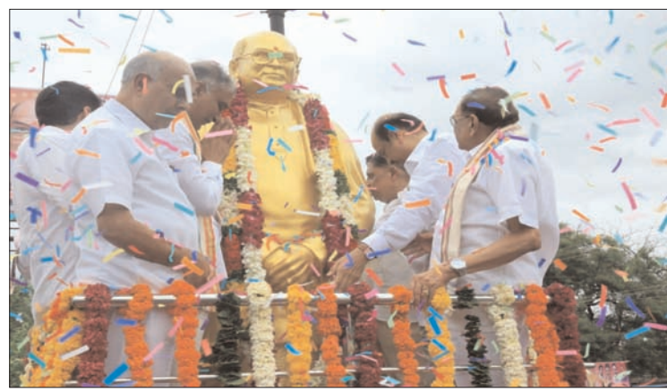
హుజూరాబాద్ - ప్రభాత సూర్యుడు