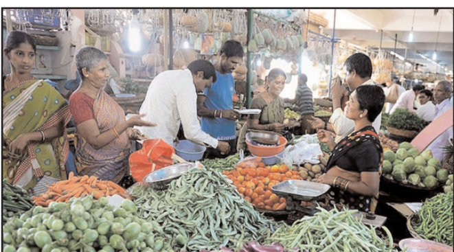
హైదరాబాద్ - ప్రభాత సూర్యుడు

వర్షాలతో సతమతం అవుతున్న జనాలకు కూరగాయల ధరలు మరింత ఉక్కిరిబిక్కిరి చేస్తున్నాయి. ఉత్తరాది రాష్ట్రాల్లో చాలా చోట్ల వరదలు ముంచెత్తుతున్నాయి. ముఖ్యంగా దేశ రాజధాని ఢిల్లీలో మల్లీ యమునా నది ప్రమాదకర స్థాయిలో ప్రవహిస్తోంది. హిమాచల్ ప్రదేశ్ లోనూ వరదలు చుట్టుముట్టాయి.