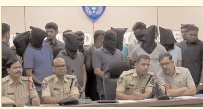
హైదరాబాద్ - ప్రభాత సూర్యుడు

తెలంగాణ పబ్లిక్ సర్వీస్ కమిషన్ పేపర్ లీక్ వ్యవహారంలో నిందితుల అరెస్ట్ కొనసాగుతోంది. ఈ కేసులో ఇప్పటి వరకు 90మంది నిందితులను సిట్ అరెస్ట్ చేసింది. గ్రూప్ 1 ప్రిలిమ్స్ పేపర్ లీక్ తో మొదలైన కేసు దర్యాప్తు రకరకాల మలుపులు తిరిగింది తెలంగాణ పబ్లిక్ సర్వీస్ కమిషన్ పేపర్ లీక్ వ్యవహారంలో నిందితుల సంఖ్య 100కు చేరువలో ఉంది. ఇప్పటికే ఈ కేసులో 90 మందిని సిట్ దర్యాప్తు బృందం అరెస్టు చేసింది. పేపర్ లీక్ వ్యవహారం మొదట గ్రూప్ వన్ ప్రిలిమ్స్ ప్రశ్నాపత్రాలకు మాత్రమే పరిమితం అయ్యిందని భావించినా మరో నాలుగు పరీక్షల ప్రశ్నాపత్రాలు కూడా లీకైనట్లు అధికారులు గుర్తించారు. పేపర్ లీకేజీ విషయం వెలుగు చూసిన తర్వాత ఈ వ్యవహారంతో ప్రమేయం ఉన్న వారు తప్పించు కోడానికి