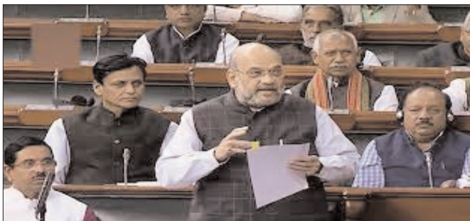
న్యూఢిల్లీ- ప్రభాత సూర్యుడు

మణిపూర్ రాష్ట్రంలో జరుగుతున్న అల్లర్లు, హింసాకాండపై సోమవారం (జూలై 24) పార్లమెంట్ ఉభయ సభల్లో పెద్ద దుమారమే రేగింది. దీంతో ఈ విషయంపై కేంద్ర హోంమంత్రి అమిత్ షా కూడా వివరణ ఇవ్వాలి వచ్చింది. మణిపూర్ సమస్య గురించి సభల్లో చర్చించడానికి తాము రెడీగా ఉన్నామని అమిత్ షా లోక్ సభలో వెల్లడించారు. ఈ అంశంపై చర్చకు సహకరించాలని ప్రతిపక్షాలను అభ్యర్థిస్తున్నానని అమిత్ షా అన్నారు. ఈ సున్నితమైన అంశం గురించి దేశ ప్రజలకు నిజం తెలియడం చాలా ముఖ్యమని అన్నారు. మొత్తానికి సభ్యుల నినాదాలు, గందరగోళం మధ్య లోక్ సభ మంగళవారం (జూలై 25) ఉదయం 11 గంటలకు వాయిదా పడింది. పార్లమెంటు వర్షాకాల సమావేశాల సందర్భంగా సోమవారం రాజ్యసభ, లోక్ సభ రెండింటిలోనూ ప్రతిపక్ష సభ్యులు మణిపూర్ పై ప్రధాని మోదీ ప్రకటన