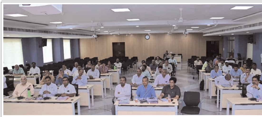
జగిత్యాల - ప్రభాత సూర్యుడు