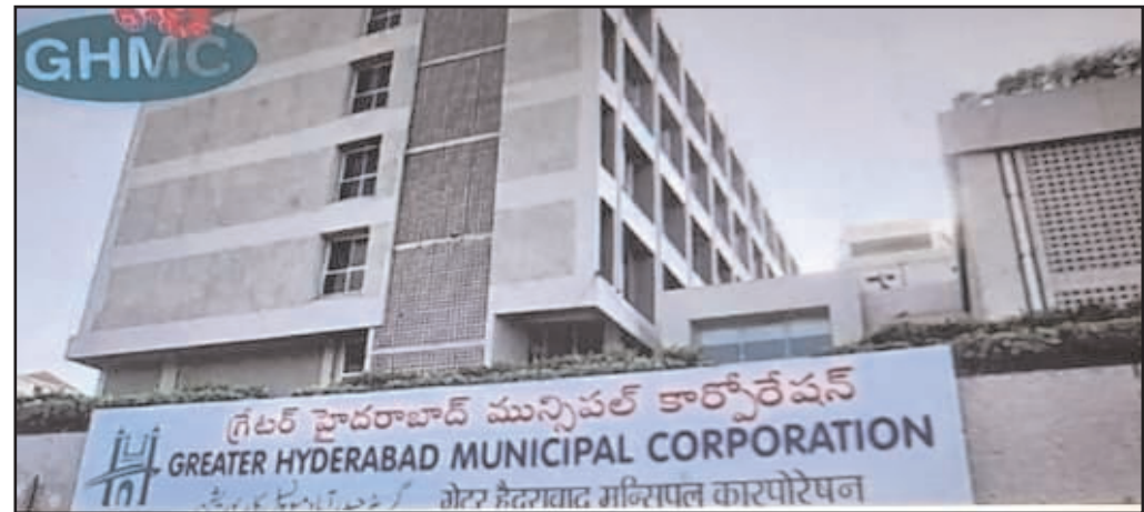
అయితే మాన్యువల్ సమస్యల పరిష్కారానికి సమస్యలు పరిష్కరించడంలో జీహెచ్ఎంసీ ఆలస్యం జీహెచ్ఎంసీ దాదాపు 24 గంటల సమయం చేస్తుండటం పట్ల నగరవాసులు ఆగ్రహం వ్యక్తం తీసుకుంటున్నట్లు తెలుస్తోంది. వెనువెంటనే చేస్తున్నారు.

హైదరాబాద్ - ప్రభాత సూర్యుడు : వర్షాకాలంలో వచ్చే సమస్యలను పరిష్కరించేందుకు ఏర్పాటు చేసిన జీహెచ్ఎంసీ టోల్ ఫ్రీ నెంబర్లు స్పందించ కుండాపోయాయి. నగర వాసులు చేస్తున్న వర్షాకాలం ఫిర్యాదులను బల్దియా కంట్రోల్ రూమ్ పట్టించుకోని పరిస్థితి. 040-2111 1111 వందల సంఖ్యలో కార్ట్ వస్తున్నప్పటికీ సిబ్బంది నిర్లక్ష్యంగా వ్యవహరిస్తోంది. పదుల సార్లు కార్ట్ చేసే గాని కంట్రోల్ రూమ్ లిఫ్ట్ చేయట్లేదు అంటూ నగరవాసుల మండిపడుతున్నారు. పది కార్ట్ లో కేవలం ఒకటి రెండు కార్ట్ కు మాత్రమే జీహెచ్ఎంసీ స్పందిస్తోంది. బల్దియా కంట్రోల్ రూమ్ ఇన్ ఛార్జ్ గా ఓ రిలైట్ అధికారి ఉన్నారు. రోజుకు 500 నుంచి 700 వరకు ఫిర్యాదులు కుప్పలు తెప్పలుగా వచ్చిపడుతున్నాయి.