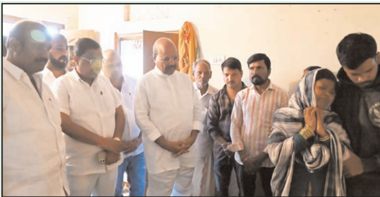
- అబ్దుల్లాపూర్ మెట్ - ప్రభాత సూర్యుడు