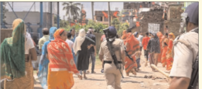
హైదరాబాద్ - ప్రభాత సూర్యుడు

-చోరీ చేశారన్న కోపంతో మహిళలపై దాడి - అర్ధనగ్నంగా ఊరేగింపు