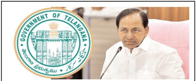
హైదరాబాద్ - ప్రభాత సూర్యుడు

త్వరలోనే ప్రభుత్వ ఉద్యోగులకు గుడ్ న్యూస్ చెప్పేందుకు సిద్ధమవుతోంది తెలంగాణ సర్కార్. ప్రభుత్వ ఉద్యోగుల జీతభత్యాల అధ్యయనం కోసం 2వ పీఆర్సీ ప్రకటించే అవకాశం ఉంది.