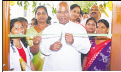
బస్టీ దవాఖాన, మహిళా భవన ప్రారంభించిన అనంతరం ప్రజా ప్రతినిధులతో ఎమ్మెల్యే కిషన్ రెడ్డి

అబ్దుల్లాపూర్ మెట్ - ప్రభాత సూర్యుడు ప్రజల ఆరోగ్యానికే తెలంగాణ ప్రభుత్వ ప్రధాన ప్రాధాన్యత కల్పిస్తుందని ఇబ్రహీంపట్నం నియోజకవర్గం ఎమ్మెల్యే మంచెరెడ్డి కిషన్ రెడ్డి అన్నారు.